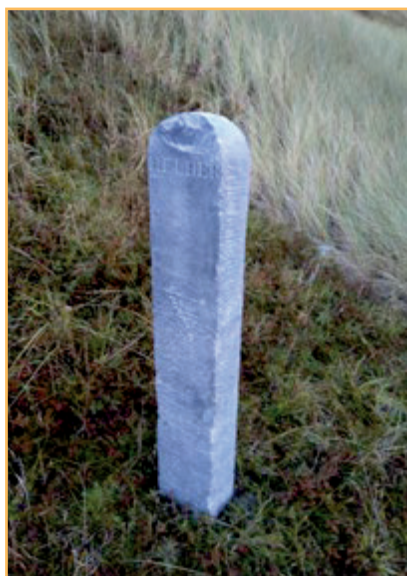
Grenspaal Den Helder.

Door de hier geschetste gang van zaken was Helder & Huisduinen de enige gemeente in Noord-Holland, en misschien wel de enige gemeente in heel Nederland, met bij het kadaster een gewoon én een herzien proces-verbaal van grensscheiding.