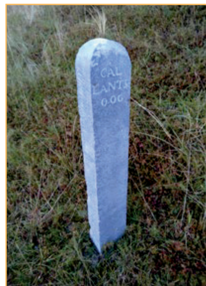
Grenspaal Callantsoog.