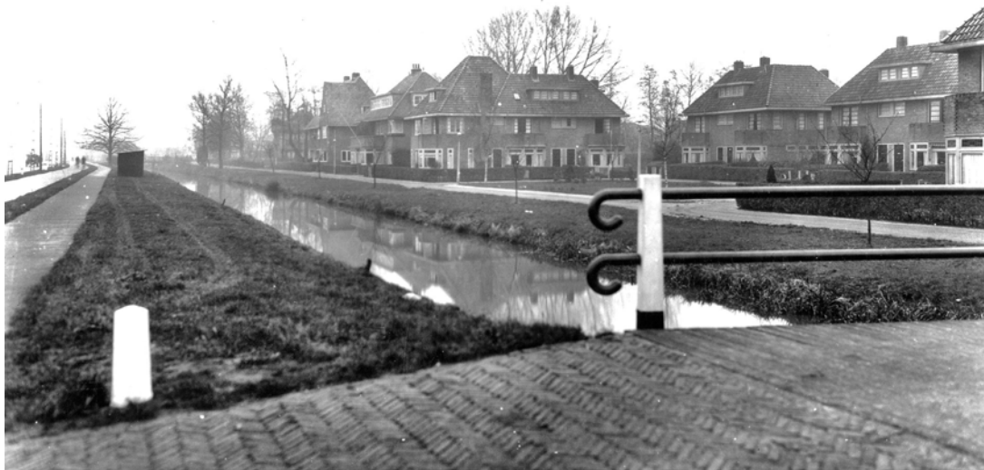
Woningen langs de zuidkant van de Utrechtseweg tussen de Veldzichtstraat en de A27, gebouwd begin jaren dertig van de vorige eeuw op 150 tot 400 meter van de Werken van Griffenstein. Foto uit eind jaren dertig.

Van de mogelijkheid het kerkbestuur onthefing te verlenen van het bepaalde in de verordening van 9 september wenste de commandant geen gebruik te maken.