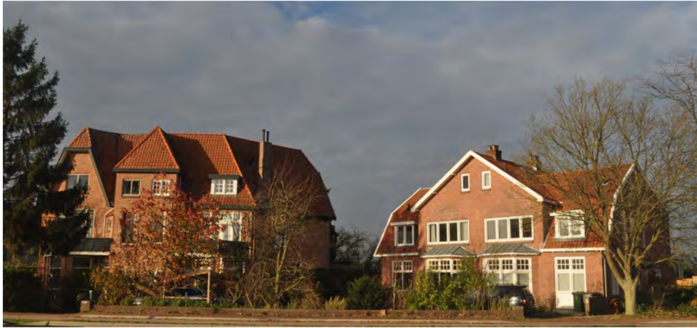
Utrechtseweg 332 tot 348 in 2015. De dubbele woning rechts werd in 1921/1922 gebouwd door de Biltse aannemer Gerrit Starink op de binnenste verboden kring, 300 meter van de Werken van Griftenstein. De dubbele woning links uit 1924 werd eveneens gebouwd door Starink.

ongehinderd mocht bouwen (11). De verklaring die hij had moeten tekenen, waarin hij afstand deed van het recht op schadeclaims, werd aan hem teruggezonden (12); voortaan golden voor zijn percelen geen beperkingen meer op grond van de kringenwet. Voor de overige gebieden waar de wet van toepassing was verklaard, veranderde er echter niets.