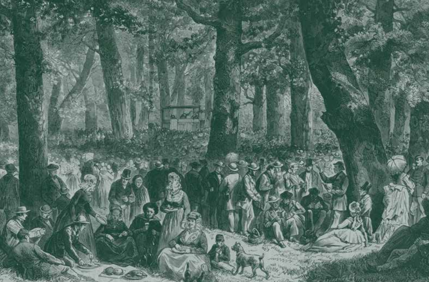
Zendingsfeest op Boekenrode, 23 juli 1873.