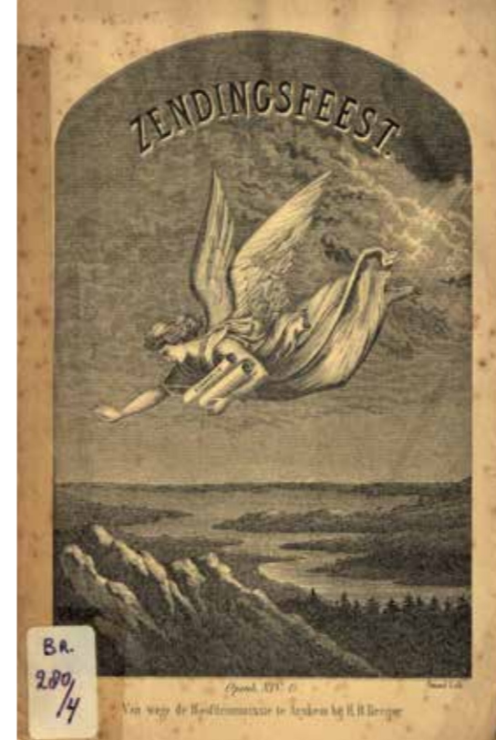
Programmaboekje van het Tiende Algemeen Evangelisch Nationaal Zendingfeest op Boekenrode, 23 juli 1873.

Sinds 1863 werden er in Nederland jaarlijks op wisselende locaties landelijke zendingsfeesten gehouden. In 1873 werd daarbij voor het eerst het landgoed Boekenrode in Aerdenhout aangedaan. Twee jaar later kwamen er opnieuw. Hoe ging het er daar aan toe?