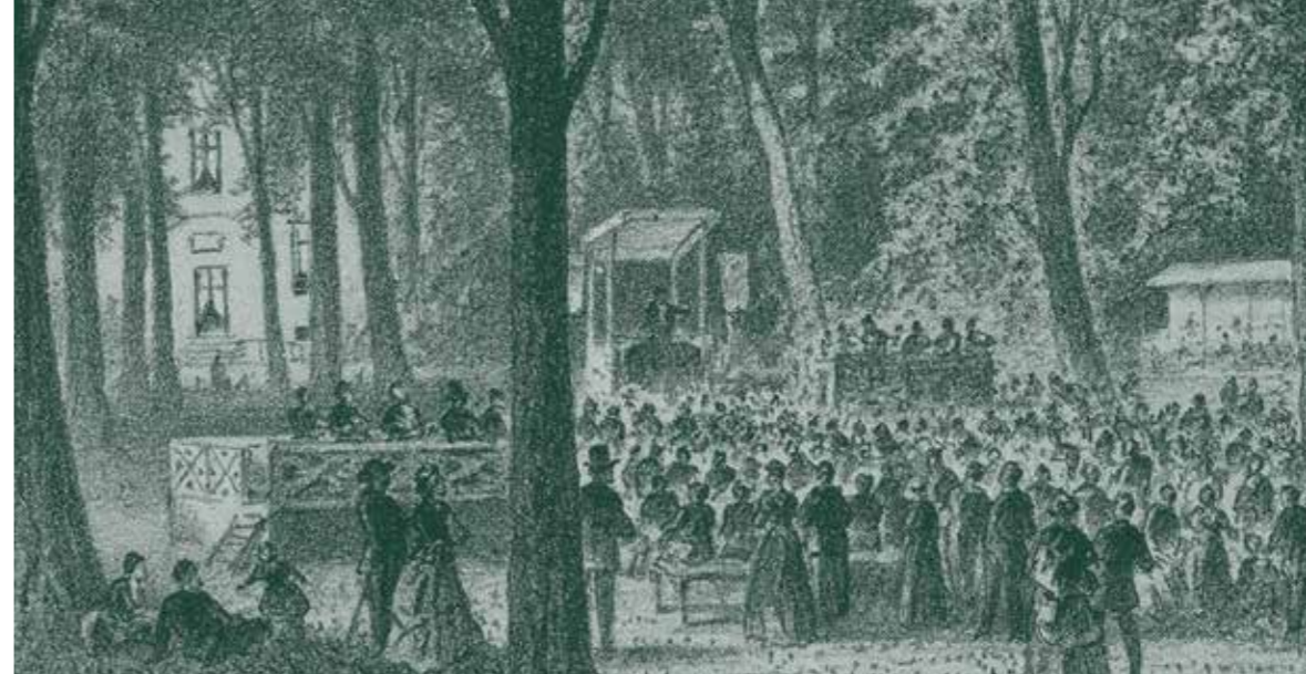
Een van de vier lithografieën van het zendingfeest op Boekenrode, 7 juli 1875.

Advertentie in De Standaard van 9 juli 1875.