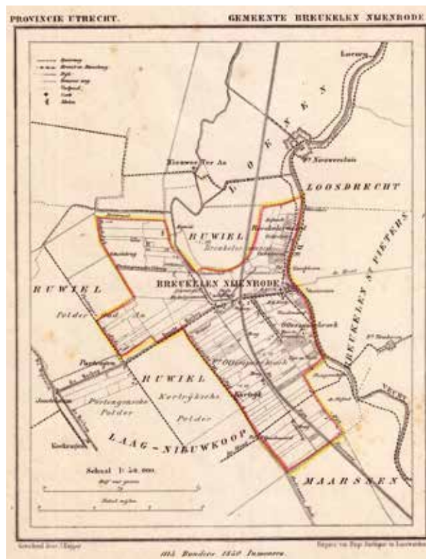
Figuur 5: Idem van de gemeente Breukelen Nijenrode. Datering vermoedelijk 1870.

Elke negentiende-eeuwse gemeente kreeg een eigen kaartblad. Doordat niet iedere gemeente even groot was en de vorm van het grondgebied nu eens compact en dan weer langgerekt, is de schaal van de kaartjes variabel. Breukelen Nijenrode, Breukelen St. Pieters en Ruwiel werden weergegeven op een schaal van 1 : 50 000; het