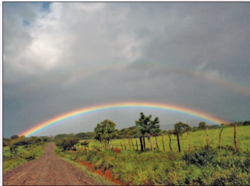
1. Regenboog in de omgeving van Volcán Rincón de la Vieja, Guanacaste, Costa Rica.