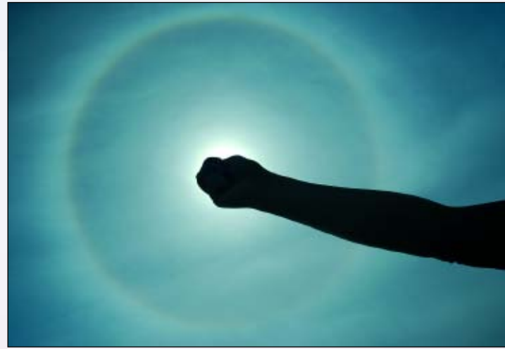
4. Melklucht ( cirrostratus ) met kleine kring of halo van 22 graden, het bekendste haloverschijnsel. De binnenrand van de ring, aan de kant van de zon, vertoont vaak een rode of roodbruine tint. Verder is het verschijnsel weinig kleurrijk. Haloverschijnselen zijn te zien in bewolking die uit ijskristallen bestaat.

vaakst wordt genomineerd als derde regenboog, is te zien in figuur 3. De boogvorm en de kleurenrijkdom zijn beide aanwezig – in dat opzicht lijkt er sprake van een regenboog. Andere zaken kloppen echter niet. De zon of het tegenpunt van de zon bevindt zich niet in het middelpunt, het zenit staat namelijk centraal. Bovendien is er geen regen te bekennen – er is hooguit wat sluierbewolking. Conclusie: dit is geen derde regenboog.