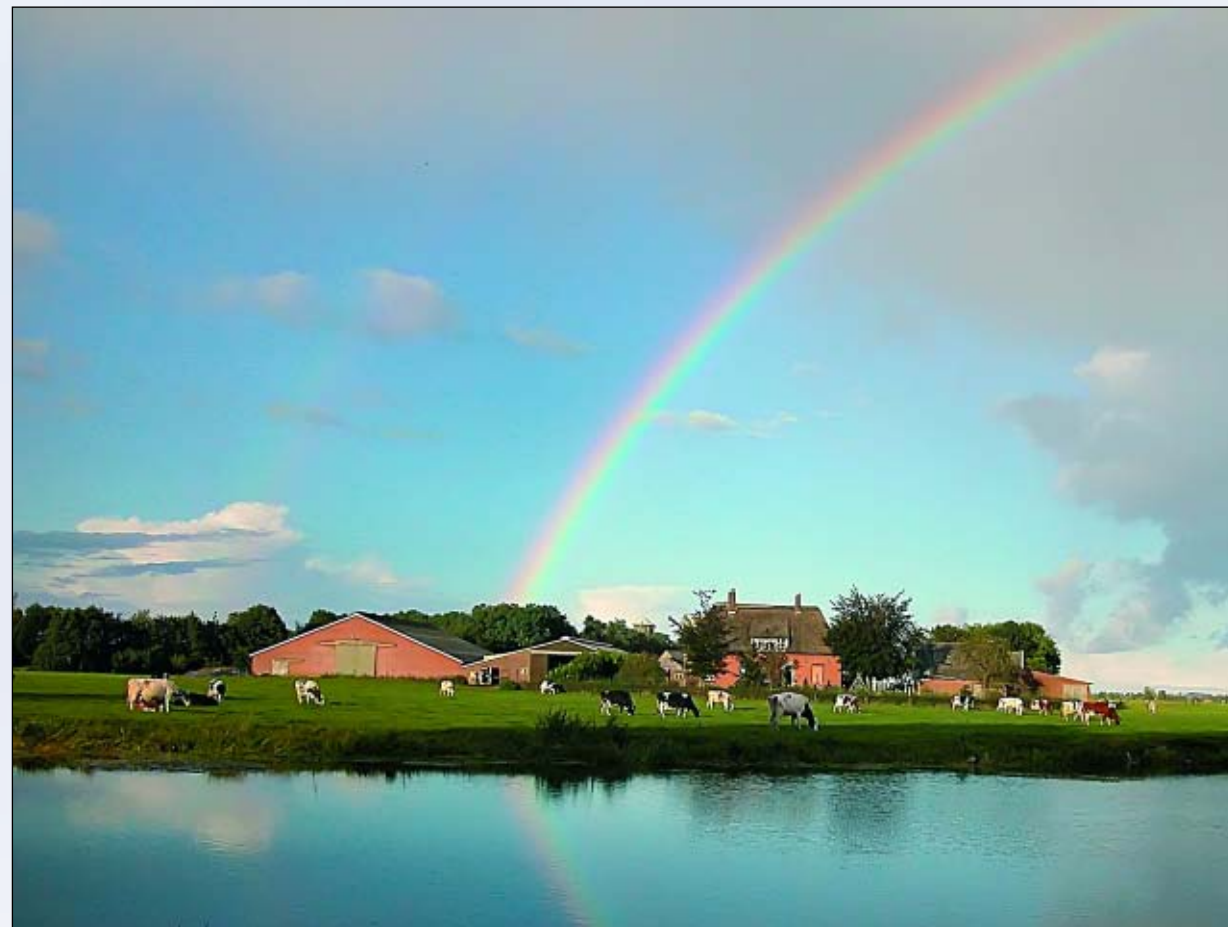
5. Regenboog boven de Deurvorster boer en weerspiegelde regenboog. Locatie: Engbergen (Gendringen).

het een regenboog is. De kleine kring vertoont weliswaar meestal een roodachtige binnenrand, maar roept qua kleurenrijkdom en positie gewoonlijk geen enkele associatie met de regenboog op. Bij de circumzenitale boog, zoals de halo van figuur 3 in de meteorologische optica bekend staat, is dat wel het geval: de kleuren zijn zelfs nog zuiverder dan die van de regenboog zelf. De boog is een gedeelte van een cirkel – meestal niet meer dan een kwart –