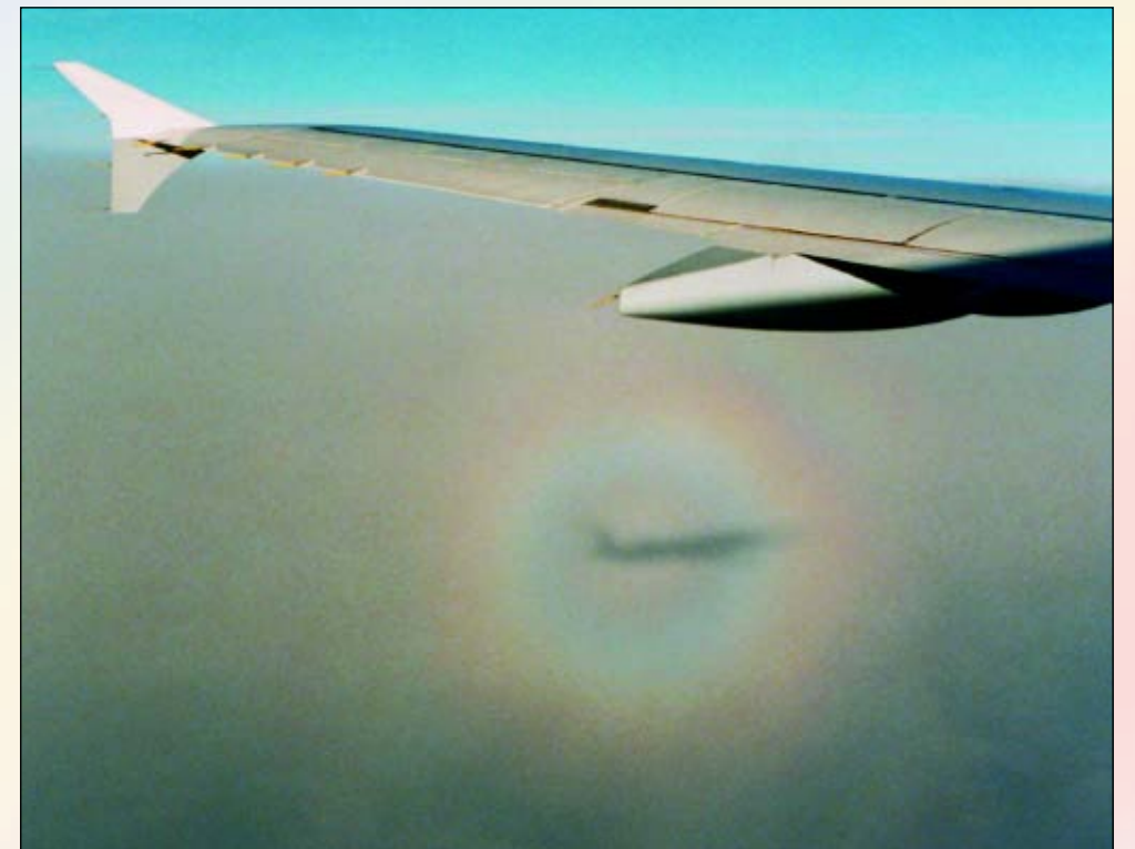
7. Glorie rond de schaduw van een vliegtuig.

hoofdboog. De lichtbron van deze regenboog bij weerspiegelde zon is het spiegelbeeld van de zon in een glad wateroppervlak. De weerspiegelde zon bevindt zich even ver onder de horizon als de zon erboven staat. Als gevolg daarvan staat het tegenpunt van de weerspiegelde zon even ver boven de horizon als het tegenpunt van de 'echte' zon eronder staat. Een volledig ont-