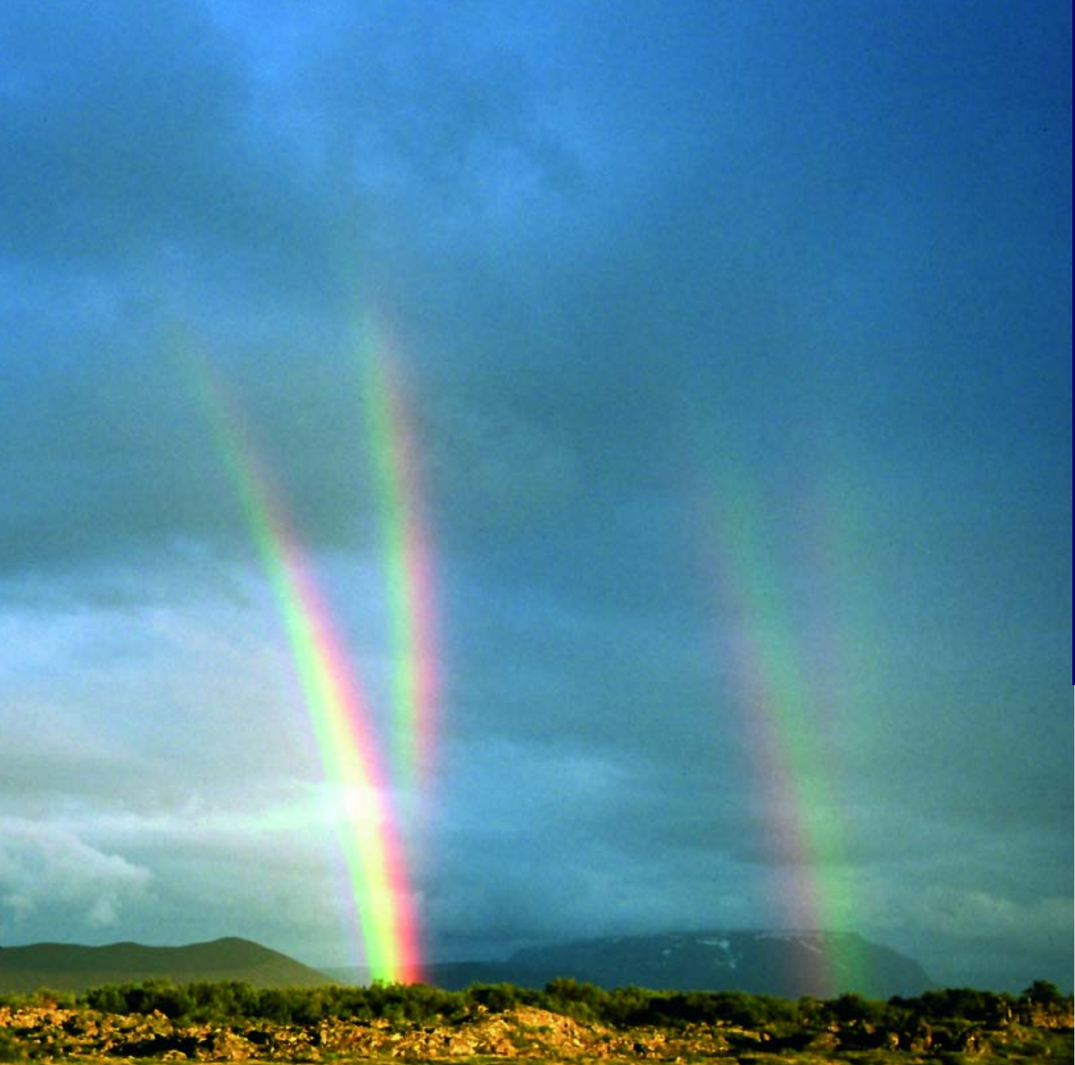
8. Regenbogen bij weerspiegelde zon. De weerspiegeling van de zon in rustig water treedt op als lichtbron voor de twee ongebruikelijke bogen. Locatie: Myvatn, IJsland.

weerspiegelde zon als lichtbron optreedt.