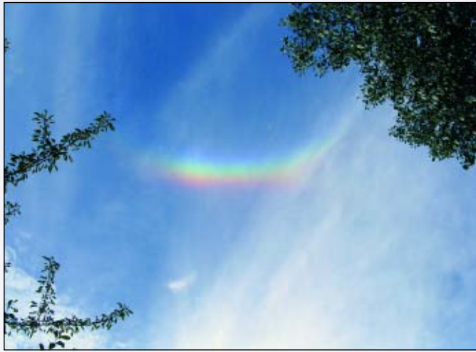
3. Circumzenitale boog: een kleurrijk verschijnsel, maar géén regenboog. Het haloverschijnsel ontstaat in ijskristallen van de bewolking van de melklucht ( cirrostratus ) en heeft de vorm van een boog rond het zenit.