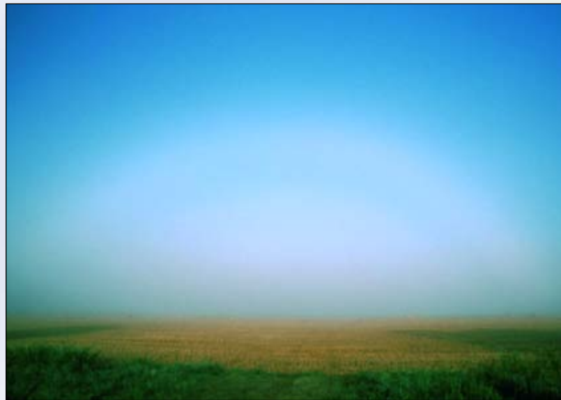
2. Mistboog.

staan er verschijnselen die kleurrijk zijn, een boogvorm bezitten en waarbij regendruppels bij de vorming ervan een cruciale rol spelen? Een zoektocht naar zo'n regenboog kun je op twee manieren aanpakken. Je kunt naar buiten gaan en 'veldwerk' verrichten of de theorie induiken. De foto's van de figuren 3 en 5-8 geven de resultaten van zulk veldwerk; op de theorie gaan we later in.