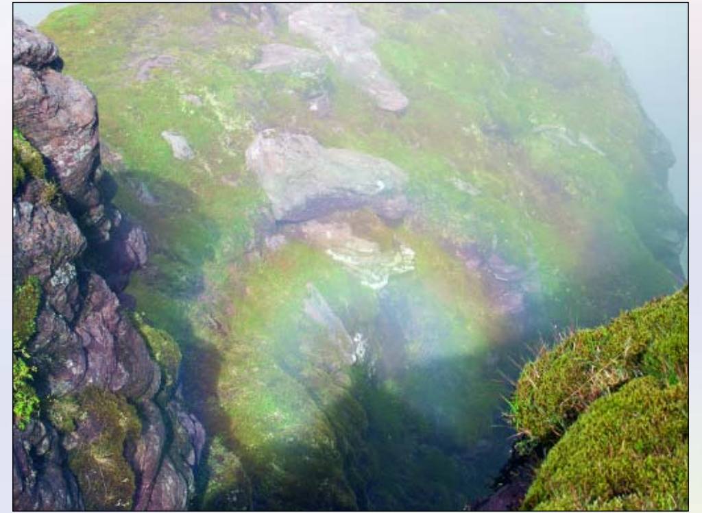
6. Glorie op mist of bewolking in An Teallach, Schotland.

Nog meer recht op de titel 'derde boog' heeft mijns inziens de ongebruikelijke, rechtopstaande boog in figuur 8 (links van het midden) waarvan de voet samenvalt met de