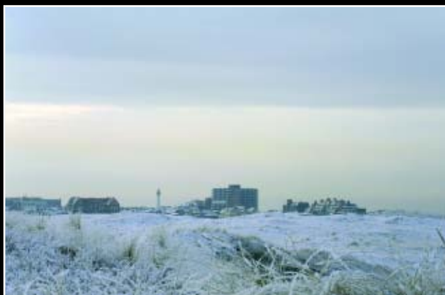
8. Altostratus is een egaal, gelaagd, grijs wolkendek. De bewolking bevat al dan niet onderkoelde waterdruppels en/of sneeuw-kristallen. Vaak is er een streperige structuur te onderkennen. Als de bewolking begint binnen te drijven, zijn sommige gedeelten van de altostratus dun genoeg om nog de positie van de zon te kunnen bepalen. Na verloop van tijd wordt de wolkenlaag meestal dikker en verdwijnt de zon. De wolkenbasis bevindt zich tussen 2200 en 5500 m hoogte.