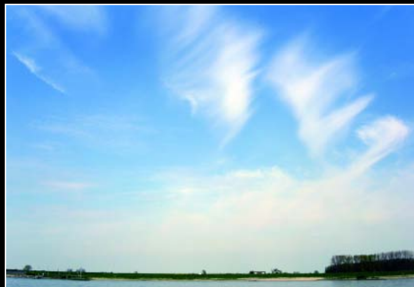
10. Cirrus bevindt zich boven 5 km hoogte en bevat uitsluitend ijskristallen. De bewolking heeft meestal de vorm van fijne witte draden of smalle banden. Cirrus wordt gekenmerkt door een vezelachtige structuur en een tint van zijdeglaans. Doordat er op de hoogte waarop deze wolk voorkomt, vaak veel wind staat (soms tot wel 75 m/s), wordt de bewolking en de lichte sneeuw die eruit valt maar de grond nooit bereikt, uitgewaaid over de bemel.

radar en weerballonnen met radiosondes, was bewolking het enige handvat om iets te weten te komen over de processen die zich in de atmosfeer afspelen op de hoogte waar ze zich bevindt. Gaandeweg verliezen de wolken-geslachten echter terrein. De computermodellen van de atmosfeer waarop de meeste weersverwachtingen gebaseerd zijn, maken wel onderscheid tussen gelaagde bewolking en stapelwolken, maar negeren de verdere nuanceringen die Howard en zijn opvolgers aanbrachten. De meeste gebruikers zijn vooral geïnteresseerd in de hoeveelheid zon. De luchtvaart kijkt alleen naar eventuele gevaren of ongemakken, meestal samenhangend met mist of stratus en met sterk ontwikkelde stapelwolken of met buien. Automati-