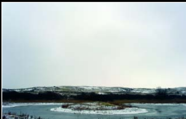
9. Nimbostratus is donker en grauw. De randen zijn vaag of ontbreken geheel. Er valt onafgebroken regen of sneeuw uit. De wolkenlaag is zo dik dat de zon erdoorheen niet zichtbaar is. De bewolking bevat al dan niet onderkoelde wolkendruppels, regendruppels, ijskristallen en sneeuwvlokken. Vaak zijn onder het wolkendek gelijktijdig nog wolkenflarden aanwezig die snel van vorm veranderen. Hoe dikker de bewolking, des te meer neerslag eruit valt. Bij grote hoeveelden kan de wolkenbasis zich rond de 200-500 m hoogte bevinden; als er weinig regen uit valt zo rond de 1500-2000 m hoogte. Nimbostratus heeft een lagere wolkenbasis dan altostratus en is vele malen donkerder van tint.