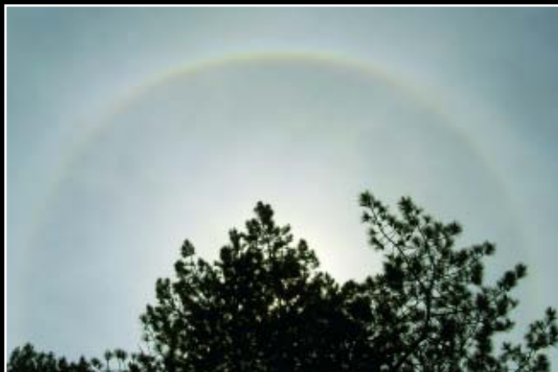
7. Cirrostratus ziet er meestal uit als een doorzichtige, witachtige, egale wolkenluiser; vandaar de Nederlandse naam 'melklucht'. De bewolking zit op meer dan 5 km hoogte en bevat daardoor alleen ijskristallen. Vaak zijn fraaie, kleurige lichtverschijnselen zichtbaar, zogebeten halo's, waarvan de bekendste variant een kring om de zon of maan is. Doordat cirrostratus erg dun is, kan deze 'kleine kring' soms de enige aanwijzing zijn voor de aanwezigheid van cirrostratus.