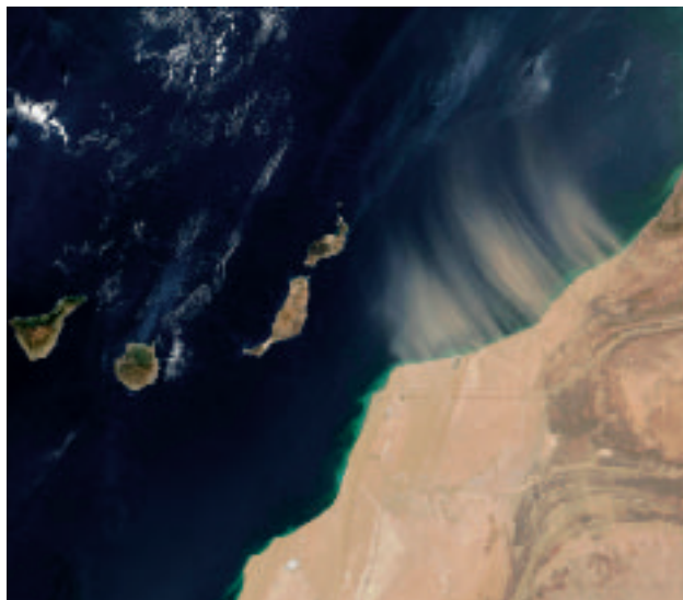
Figuur 2: Stofstorm boven de Middellandse Zee, 3 oktober 2003. Instrument: MODIS. Satelliet: Aqua.