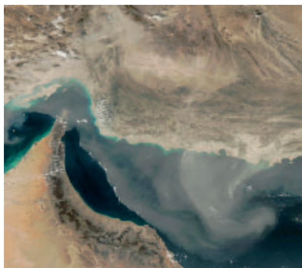
Figuur 3 (links): Stofstorm boven de Rode Zee, 25 juni 2003. Instrument: MODIS. Satelliet: Aqua.