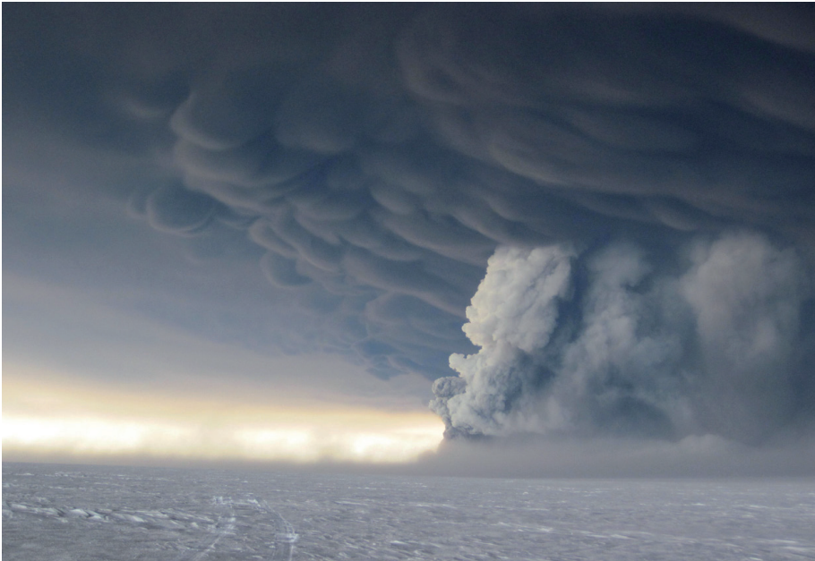
Figuur 3. Uitbarsting van de Grímsvötn op IJsland, gefotografeerd in de avond van 22 mei 2011. Onder het scherm zit mammatus, zoals ook vaak optreedt onder het aambeeld van een supercel.