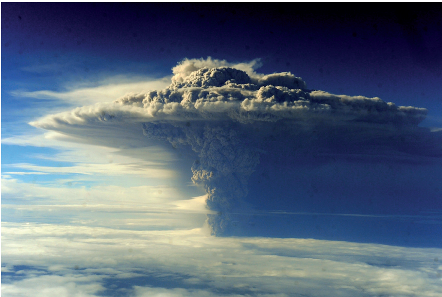
Figuur 4. Luchtfoto van de aswolk van een uitbarsting van de Puyehue in Zuid-Chili op 5 juni 2011.