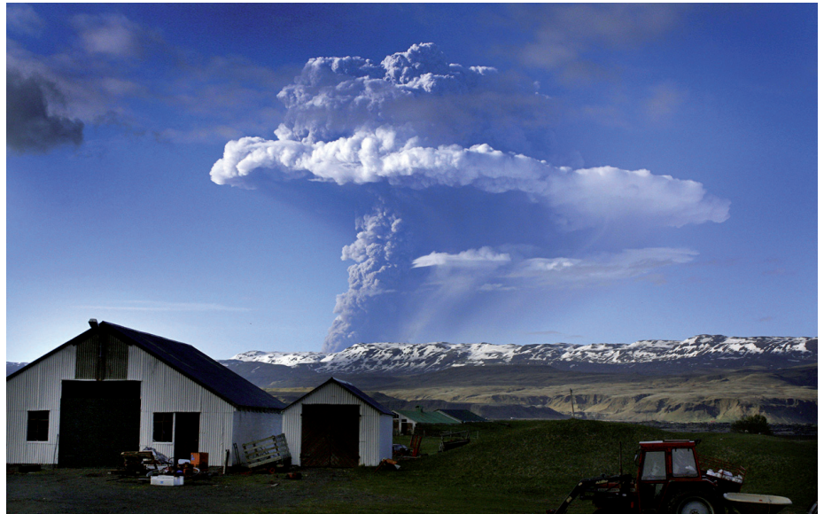
Figuur 1. Uitbarsting van de Grímsvötn op IJsland op 21 mei 2011. De foto toont de paddestoelvorm van de uitgestoten gassen en deeltjes, met het karakteristieke scherm en een overshooting top.

Aan de bovenzijde van de supercel bevindt zich een min of meer cirkelvormig scherm van cirrusbewolking, waarvan het buiten het massieve gedeelte van de bui uitstekende deel bekend staat als aambeeld. In het midden ervan dringt de opstijgende lucht door het scherm heen: de zogeheten overshooting top . Aan de onderzijde van het aambeeld kan vaak