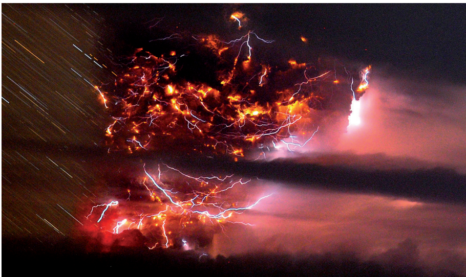
Figuur 5. Bliksemontladingen tijdens een uitbarsting van de Puyehue, begin juni 2011.

was de heftigste sinds 1902; de voorlaatste eruptie vond plaats op 1 november 2004.