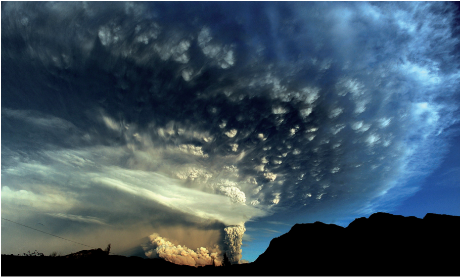
Figuur 6. Aswolk met scherm en mammatus tijdens de uitbarsting van de Puyehue in Zuid-Chili.

buitenzijde van de kolom met vulkanische as. Ook binnen de mesocycloon van een supercel treden doorgaans geen bliksemontladingen op. Men spreekt wel van een ‘bliksemgat’ in de supercel. Om hun theorie van vulkanische mesocyclonen verder te ondersteunen, zochten de genoemde auteurs aanvullende argumenten. Zo toonden ze met analyses van satellietbeelden aan dat er inderdaad sprake is van rotatie van de kolom vulkanische as en het daaraan gekoppelde scherm aan de bovenzijde ervan. Dat is geen eenvoudige opgave, want de tijd tussen twee opeenvolgende satellietbeelden is meestal te groot om de bewegingen en vervormingen van zo’n