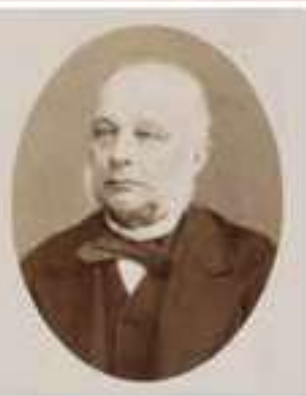
De Kuyper- kaartjes