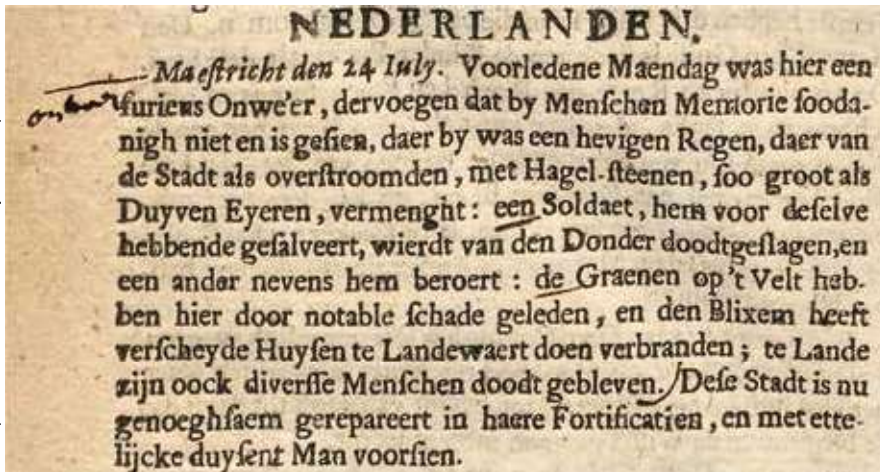
Zeventiende-eeuws krantenbericht over een hagelbui. (De gebruikte s lijkt sterk op de tegenwoordige f).