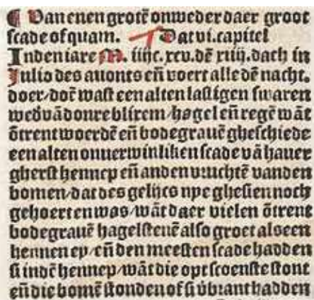
Verslag van een vijftiende-eeuwse zware hagelbui (gedeelte).

Bron: Divisiekroniek door Cornelis Aurelius/KNAW