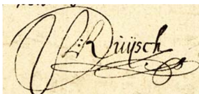
Fig. 4 Handtekening van Paulus Ruysch.

Zijn naam duikt af en toe op in verhandelingen over de uitvinding van de verrekijker 8 of de ontwikkeling van de astronomische telescoop 6 . De Zeeuwse natuurwetenschapper Isaac Beeckman maakte in zijn dagboek bij een bezoek aan Utrecht nauwkeurige aantekeningen van hoe Ruysch in 1834 bij het slijpen van lenzen te werk ging. Vermoedelijk was Ruysch ook degene die door de Leidse hoogleraar wiskunde en oosterse talen Jacob Gool aan de Franse natuurwetenschapper René Descartes als lenslijper werd aanbevolen. De gewezen Biltse schout, wijnkoper, landmeter en lenzenlijper Paulus Ruysch kan met recht een veelzijdig man worden genoemd. Hij stierf in Utrecht op 16 oktober 1683.