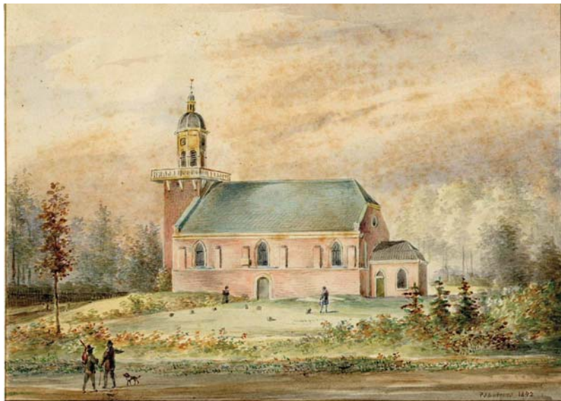
Fig. 2 De dorpskerk van De Bilt uit 1652. Prent 190 jaar later vervaardigd door P.J. Lutgers, 1842. Bron: Collectie Het Utrechts Archief, cat.nr. 200412.

Ruysch ontwikkelde daartoe twee mogelijke tracés, bracht zijn voorstellen in kaart en diende ze in 1641 in bij de vroedschap van de stad en bij de Staten van de provincie. Figuur 2 geeft een uitsnede van een van die kaarten met daarop De Bilt en omgeving. De plannen voor een Eemvaart werden in de ja-