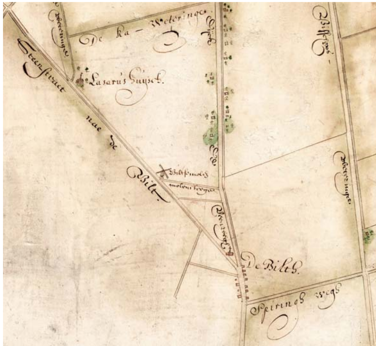
Fig. 3 De Bilt op een kaart uit 1662, met onder andere de Steenstraat naar de Bilt, de Biltse molen en nu ook de dorpskerk. Uitsnede uit een kaart die hoorde bij de plannen tot aanleg van een vaart van Utrecht naar de Zuiderzee uit 1661. Vervaardiger: Paulus Ruysch (9). Noord is rechtsboven.

ren zestig weer uit de kast gehaald. Ruysch was opnieuw betrokken bij het onderzoek naar de haalbaarheid en de uitvoering van de plannen, die ook nu weer werden afgeblazen. Een uitsnede uit de door Ruysch vervaardigde kaart van de plannen uit 1662 is afgebeeld als figuur 3.