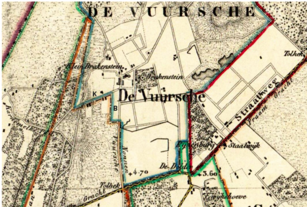
Figuur 2. De noordgrens van de gemeente de Bildt. Detail van de kaart van de provincie Utrecht, blad 2, uit 1850. De gemeentegrenzen zijn met kleur aangegeven. K: Koudelaan. B: Bouwland van Bosch van Drakenstein. Bron: Archief Eemland, kaartnummer 1001_455.

de wijzers van de klok mee; het gebied van de gemeente de Bildt bleef dus steeds aan de rechterhand. De route voerde vaak over perceelgrenzen. Zo liepen ze eerst langs de grillige noordgrens van de Bildt (zie figuur 2) tussen de landerijen door van P.W. Bosch van Drakenstein in De Vuursche enerzijds en M.J. Eyck van Zuylichem (1) in De Bilt anderzijds. Laatstgenoemde komen we verderop in het proces-verbaal nog een keer tegen, omdat hij als burgemeester van Maartensdijk voor een juiste beschrijving van de grens tussen zijn