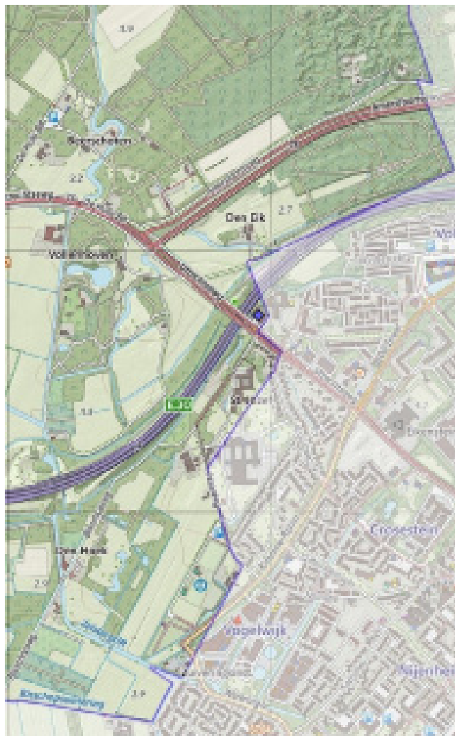
Figuur 3. Gedeelte van de grens tussen De Bilt en Zeist, 2013. De grenslijn verspringt onder andere bij de Amersfoortseweg, de Utrechtseweg en de Zeister Grift.

Op deze manier werd de hele rondgang langs de Biltse gemeentegrenzen beschreven. Bij elke overgang naar een volgende grensgemeente werden burgemeester en aanwijzer(s) van de ene grensgemeente verwisseld voor die van de volgende. Waar een wat grotere weg of vaart moest worden overgestoken, sloten de perceelgrenzen aan weerszijden veelal niet op elkaar aan, zodat er eerst een stukje langs de weg of vaart moest worden afgelegd alvorens men verder kon door of langs de bospercelen, heidevelden, boomgaarden en landerijen. Dat is bij de grens met Zeist (1) onder andere het geval bij de Praamgracht/Maartensdijkseweg (zie figuur 2 onder links van het midden bij tekst Tolhek), de Amersfoortseweg, de Utrechtseweg en de Bildtsche Vaart (Zeister Grift). Deze sprongen zijn in de hedendaagse gemeentegrenzen nog steeds terug te vinden (zie figuur 3; het tracé van de Amersfoortseweg liep destijds kennelijk over het huidige fietspad). Voor vergelijkbare verschuivingen die optraden in de grens met Maartensdijk bij het oversteken van de Hoofddijk