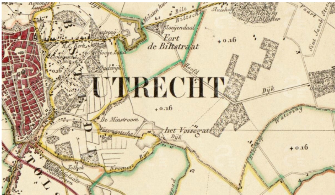
Figuur 4. De zuidwesthoek van de gemeente de Bilt, 1836 (15) tot 1896. Detail van de kaart van de provincie Utrecht, blad 3, uit 1850. De gemeentegrenzen zijn met kleur aangegeven.

na de bocht in noordelijke richting te blijven volgen, hield men echter de Bisschopswetering aan, dwars door het huidige universiteitsterrein De Uithof. Deze wetering bleef gemeentegrens, eerst met Zeist, verderop met Rhijnauwen (1) (van 1816 tot 1857 een zelfstandige gemeente) tot het punt waar ze uitkwam in de Kromme Rijn (zie figuren 1 en 4; de wetering maakt bij de Vossegatsedijk of Utrechtseweg op het destijds zuidelijkste punt van de gemeente een scherpe bocht naar rechts en blijft de dijk/weg enige tijd volgen). De Bilt reikte destijds dus tot aan de Kromme Rijn.