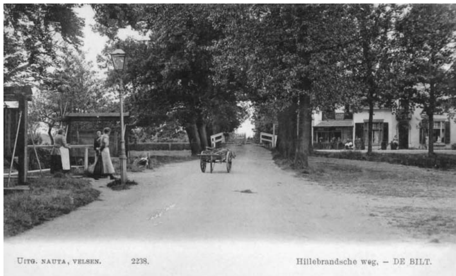
Fig. 5 Gezicht op de Hillebrandsche weg (Oude Bunnikseweg) richting Kloosterpark met links de schutsluis in de Houdringse Vaart. Datering: 1900-1905.