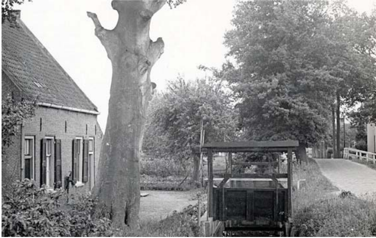
Fig. 1 Voorbeeld van een 'Maartensdijks' juk-met-handwiel-en-afdakje-schut. Het houten schot dat het water kan tegenhouden, is goed te zien. Door het valschut heen is een tweede schut zichtbaar; samen vormen ze een schutsluis. De schutten van deze foto stonden in De Bilt in de Houtringse Vaart naast de Oude Bunnikseweg; we kijken richting het Kloosterpark. De sluis en de vaart waren privé-eigendom en behoorden bij het landgoed Houtringe. De schutten werden dan ook niet bediend vanaf de openbare weg, maar vanaf het eigen terrein, links van de vaart. Datering onbekend.

113). Ze waren eigendom van het Waterschap Maartensdijk, waaronder vanaf de formele oprichting in 1866 ook het westelijk gedeelte van de toenmalige gemeente De Bilt ressorteerde; het waterschap plaatste echter geen schutten op Bilts grondgebied. Een derde voorbeeld, het houten schut aan het Leyensepad (Beukenburgerlaan 59), was privé-eigendom; het werd rond 1900 gebouwd in opdracht van Jonkheer Twiss Quarles van Ufford om het water in zijn eendenkooi op peil te houden (3). De meeste schutten stonden en