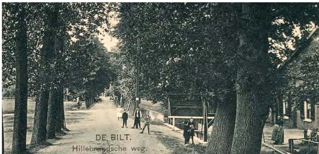
Fig. 4 Gezicht op de Hillebrandsche weg (Oude Bunnikseweg) richting het dorp met rechts de schutsluis in de Houdringse Vaart. Datering: 1917 of eerder.

werk werd aangenomen door Cornelis Schalij uit Utrecht voor 3740 gulden (7b). Een jaar later werden er bij de sluis twee woningen gebouwd, waaronder een sluiswachterswoning (7d). De sluis was, net als die in de Biltse Grift, voorzien van puntdeuren (figuur 6). Ondanks het gebruik van degelijke bouwmaterialen bleek hij bepaald niet onderhoudsvrij. Al in 1783 stelde molenmaker Hijmen van Zijll uit Bensschop een waslijst met mankementen op (7k). Het is aannemelijk dat ook gedurende de verdere levensduur van de sluis reparaties en vernieuwingen nodig waren. Het resultaat van een van die vernieuwingen uit de tweede helft van