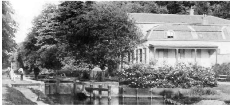
Fig. 2 De Biltse sluis (links) bevindt zich in de Biltse Grift bij het huis Sluishoef (Utrechtseweg 315, rechts) en was uitgerust met puntdeuren. Datering 1900-1905.

tegenover de Kerklaan en voor het huis Sluishoef (Utrechtseweg 315). Bij het onderhoud of herstel van deze sluis was echter geen gebruik gemaakt van het hier bedoelde type schutten, zo laten prentbriefkaarten uit het begin van de twintigste