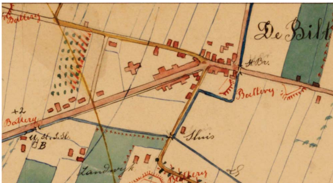
Fig. 7 Uitsnede uit de 'Militaire kaart van de stad Utrecht met gedeelten van Bunnik en De Bilt'. De waterwegen zijn aangegeven in blauw. Vlak voor de Houtringse Vaart uitkomt in de Biltsche Vaart bevinden zich een in 1775 aangelegd sluisje en twee in 1776 gebouwde woningen, waaronder een sluiswachterswoning. Datering 1865-1866.

De sluis in de Houtringse Vaart is onder andere aangeduid op kaarten uit de negentiende eeuw, zoals de topografisch militaire kaart, verkend in 1849 (11), de gemeentekaart van