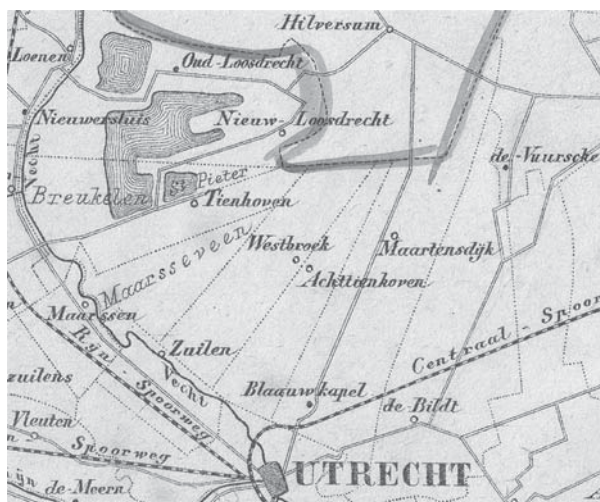
Fig. 3. Uitsnede uit kaart van de provincie Utrecht uit de Gemeente-atlas van Utrecht met daarop onder andere Maartensdijk, Achttienhoven, Westbroek en buurgemeenten. Datering: 1866. De gemeentegrenzen zijn aangegeven met stippellijnen. De namen van plaatsen die zijn aangeduid met open rondjes, zijn tevens gemeente-namen. De provinciegrens is slordig ingekleurd.