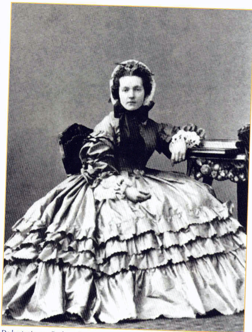
De hertogin van Brabant (koningin Maria Hendrika van België, 1836-1902), gekleed in crinoline (hoepelrok). Datering:1859 of eerder.

Het bericht laat zien dat de krant, evenals zijn voorganger Weekblad van Den Helder en het Nieuwedieper trouwens, zijn lezers goed op de hoogte hield van de trends in de mode voor dames. Rond het midden van de negentiende eeuw was de onpraktische en brandgevaarlijke crinoline zeer populair. De krant volgde de ins en outs van deze kleding met belangstelling, leedvermaak en spot. Zo nam het kledingstuk en daardoor de draagster ervan veel ruimte in. In België werd zelfs melding gemaakt van een crinoline met een doorsnede van 2,58m. Door de omvang van de hoepelrok kon men niet altijd een gebouw, tram of boot in of uit. Ook bleven de modegevoelige draagsters wel vastzitten in deurkozijnen en toegangspoortjes of bleven ze ergens aan haken, wat soms leidde tot een val en in enkele gevallen fatale verwondingen. In rijtuigen en op