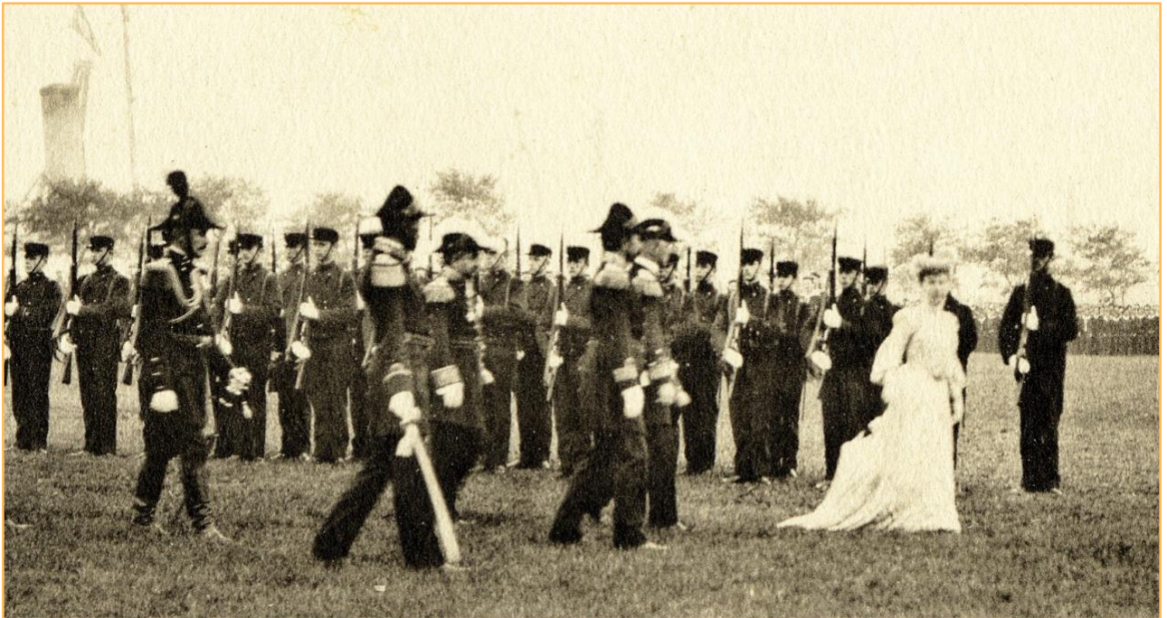
Koningin Wilhelmina bij het 50-jarig bestaan van het Kon. Instituut der Marine op 14 september 1904. Locatie: oude exercitieterrein Rijkswerf Willemsoord.

kledingstuk ook in Parijse modekringen afgedaan. Tegelijkertijd dicteerde die mode over te stappen op de sleepjapon. Volgens de krant was dat omdat je van de grote lappen stof die al geknipt waren om tot crinoline verwerkt te worden, ook sleepjaponnen kon maken. Deze overgang van crinoline naar sleepjapon werd ook in Den Helder onderwerp van gesprek, zoals moge blijken uit bijgaand, ongetwijfeld satirisch bedoeld krantenbericht van 22 mei 1867: