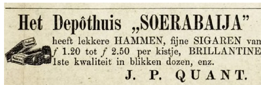
Advertentie uit de Heldersche en Nieuwedieper Courant, 30 juni 1878.

naaimachines, maar het aanbod is aanzienlijk uitgebreider, zoals bijvoorbeeld de afgebeelde advertentie laat zien. Ook had hij een grote voorraad gouden en zilveren voorwerpen die kennelijk voor de verkoop bestemd waren. Verder kon je bij hem terecht om, als je ingeloot was voor militaire dienst, daaronder uit te komen door te ruilen met iemand die was uitgeloot. Die wilde dan tegen betaling de dienstplicht van de ander wel overnemen. Hij voerde die bemiddeling uit onder de paraplu van de Maatschappij De Eendracht in Den Haag.