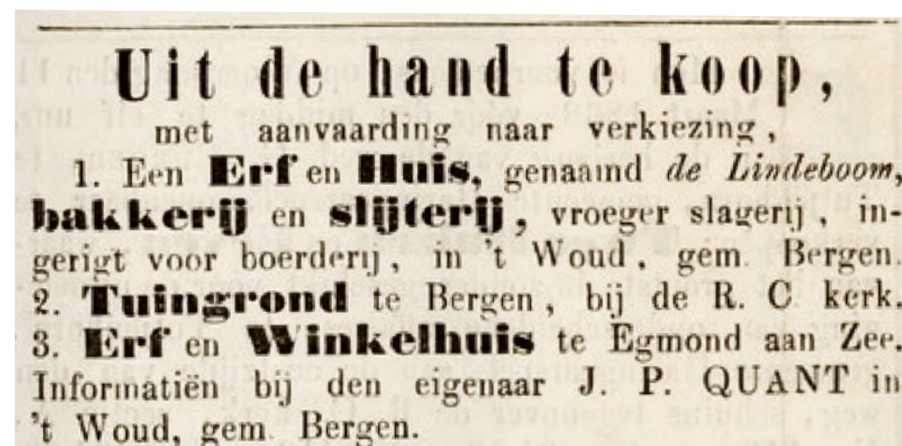
Advertentie uit de Alkmaarsche Courant, 8 maart 1868.