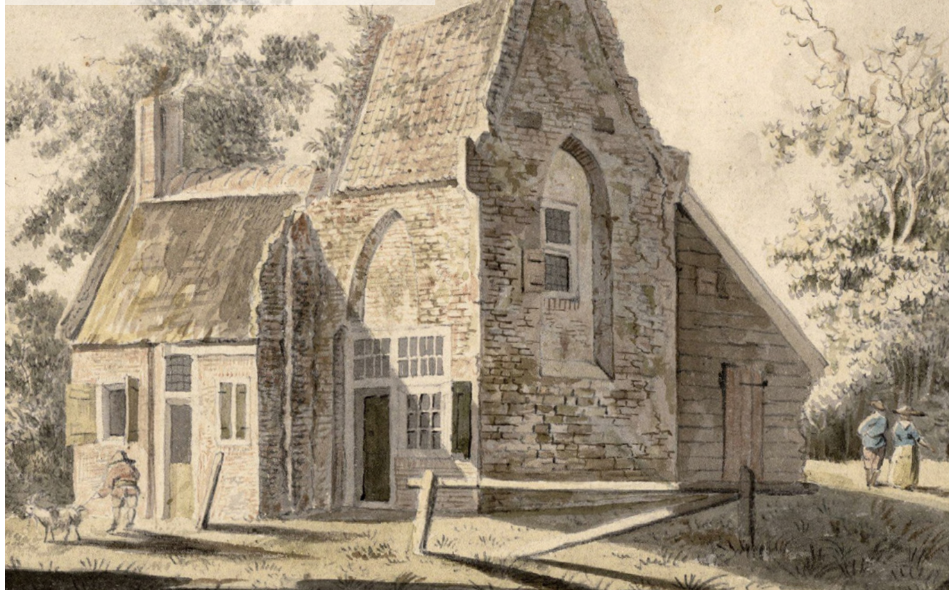
Het schooltje en de onderwijzerswoning op 't Woud in de voormalige kapel van Cosmas en Damianus. Vervaardiger: H. Tavenier. Datering: omstreeks 1785.