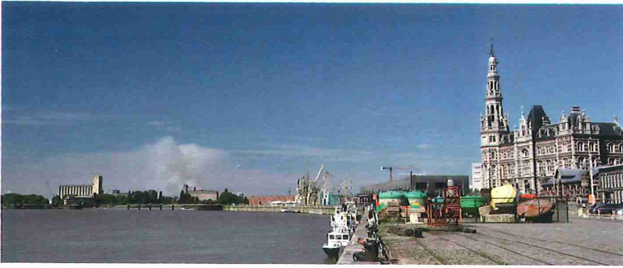
Figuur 5. Rookpluim (en pyrocumulus) van een natuurbrand op de Kalmthoutse Heide, 25 mei 2011, gezien vanaf de oever van de Schelde in Antwerpen. Een satellietbeeld van deze pluim is afgebeeld als figuur 2.

veroorzaakte bewolking in de vakliteratuur wordt genoemd.