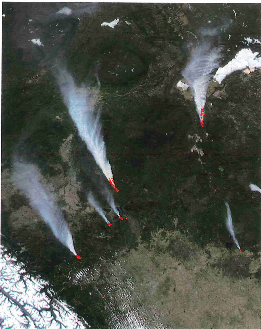
Figuur 1. Rookpluimen (en pyrocumulus) en vuurhaarden van natuurbranden in Saskatchewan (rechtsonder) en Alberta (overige), Canada, 15 mei 2011. De vuurhaard van de brand in Saskatchewan ligt even ten oosten van het op het satellietbeeld zichtbare Cold Lake. De twee kleinere rookpluimen boven Alberta waaiëren onder ander uit over Lesser Slave Lake. Instrument: MODIS. Satelliet: Aqua.

Rook van natuurbranden associëren we niet alleen met vuur en stank, maar ook met een bruin of grijzig waas. Bij uit-