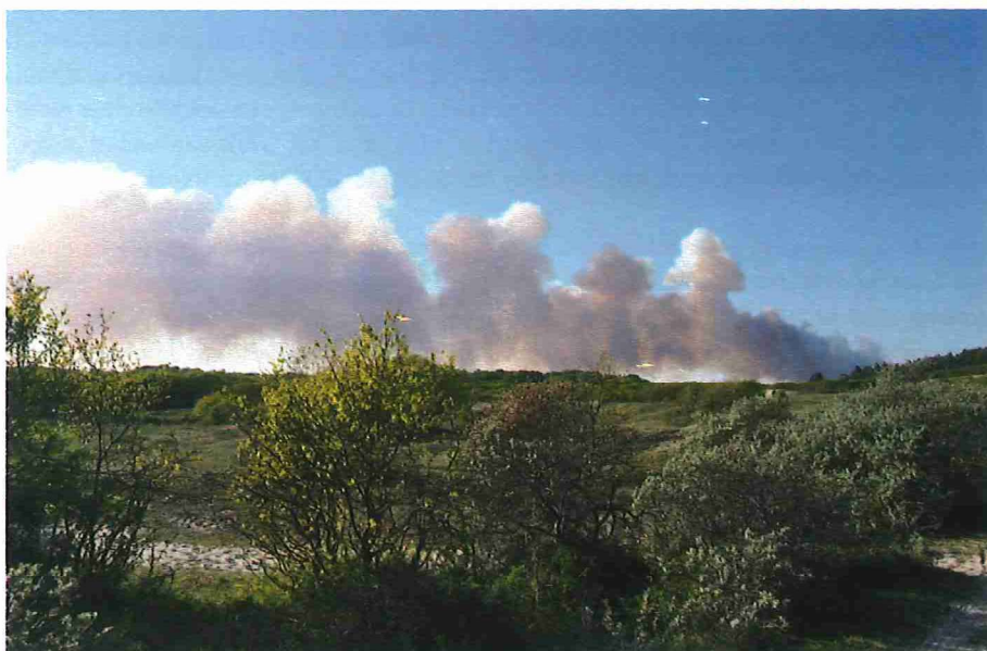
Figuur 4. Rookpluim (en pyrocumulus) van een natuurbrand in de Schoorlse Duinen, 1 mei 2011, gezien vanuit het Noordhollands Duinreservaat ten zuiden van Bergen aan Zee. De door de zon belichte delen van de 'rookpluim' zijn helder wit; in de schaduwzijde zijn de tinten donkerder en soms wat bruinig.

De foto's vanuit het ISS en vanaf de grond laten zien dat het niet om pluimen van 100 procent rook gaat, al zien we wel wat bruinige tinten. De 'rookpluim' lijkt vooral te bestaan uit stapelwolken, die overigens op het oog door de aanwezigheid van verbrandingsproducten wel een wat bruinere tint hebben dan normaal. Dergelijke stapelwolken zijn bij grote branden heel gebruikelijk. Ze ontstaan door de intense hitte van het vuur met de bijbehorende stijgende luchtbewegingen. De verbrandingsproducten die bij de brand vrijkomen, fungeren als effectieve condensatiekernen. Deze leggen samen met vocht dat reeds in de atmosfeer aanwezig is of door verdamping tijdens de brand vrijkomt, de basis voor de ontwikkeling van pyrocumuli (letterlijk: brandstapelwolken), zoals deze door branden