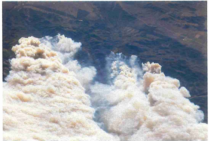
Figuur 3. Rookpluimen (en pyrocumulus) van een op 20 juli 2010 door de bliksem aangestoken natuurbrand in Twitchell Canyon, Utah, 21 september 2010, waargenomen vanaf een hoogte van 352 kilometer vanuit het internationaal ruimtestation ISS. De branden hadden op dat moment al meer dan 13000 hectare natuurgebied verwoest.

waaiende rook op grotere afstand van de vuurhaarden zijn deze tinten meestal goed terug te vinden. De bij de brandhaarden ontspringende rookpluimen hebben op de satellietbeelden in natuurlijke kleuren doorgaans echter een opvallend witte tint. Van witte rook weten we dat die kleur vaak wordt veroorzaakt door de aanwezigheid van chemicaliën, bij bosbranden is hier natuurlijk geen sprake van. Hoe komt die rook dan zo wit?