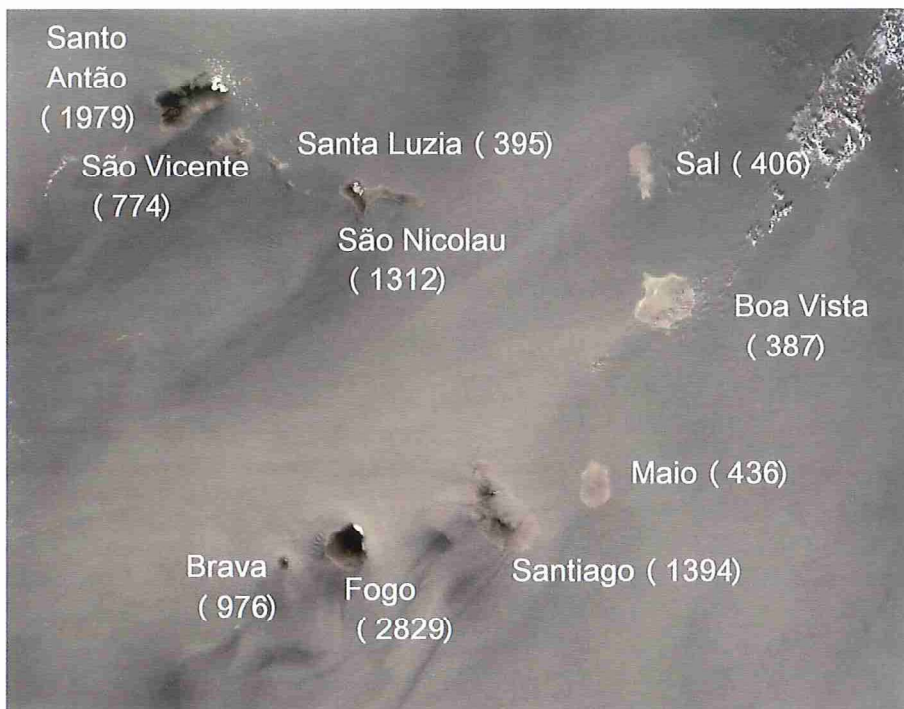
Figuur 3. Kaart van Kaapverdië. Als ondergrond dient het middagbeeld van dezelfde dag als figuur 1: 7 februari 2012, 15.00 UTC (middagbaan). Bij de namen van de eilanden is tussen haakjes de hoogte boven zeeniveau van het hoogste punt op het eiland vermeld. Alleen de hogere eilanden zien we boven de zanderige luchtlaag uit steken. Aan de noordoostzijde van Santo Antão, São Nicolau en Fogo heeft zich in de tot opstijgen gedwongen lucht bewolking gevormd. (Bron: NASA, instrument: MODIS, satelliet: Aqua).

Wervelstraten zijn op satellietbeelden voor de Afrikaanse kust geregeld zichtbaar achter Madeira en de Canarische en