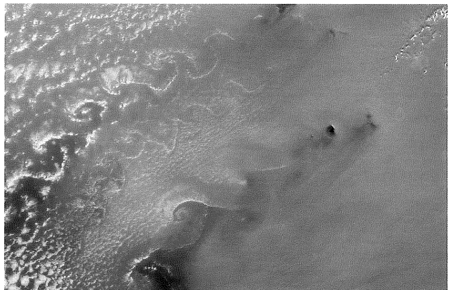
Figuur 1. Satellietbeeld van een stofstorm boven Kaapverdië. Alleen de hogere eilanden steken boven de zanderige luchtlag uit. Datum: 7 februari 2012, 11.50 UTC (ochtendbaan). (Bron: NASA, instrument: MODIS, satelliet: Terra).

Een tweede aanwijzing voor de aanwezigheid van een noordoostelijke stroming geeft de oriëntatie van de wervelstraten van Von Kármán, die zich stroomaf-