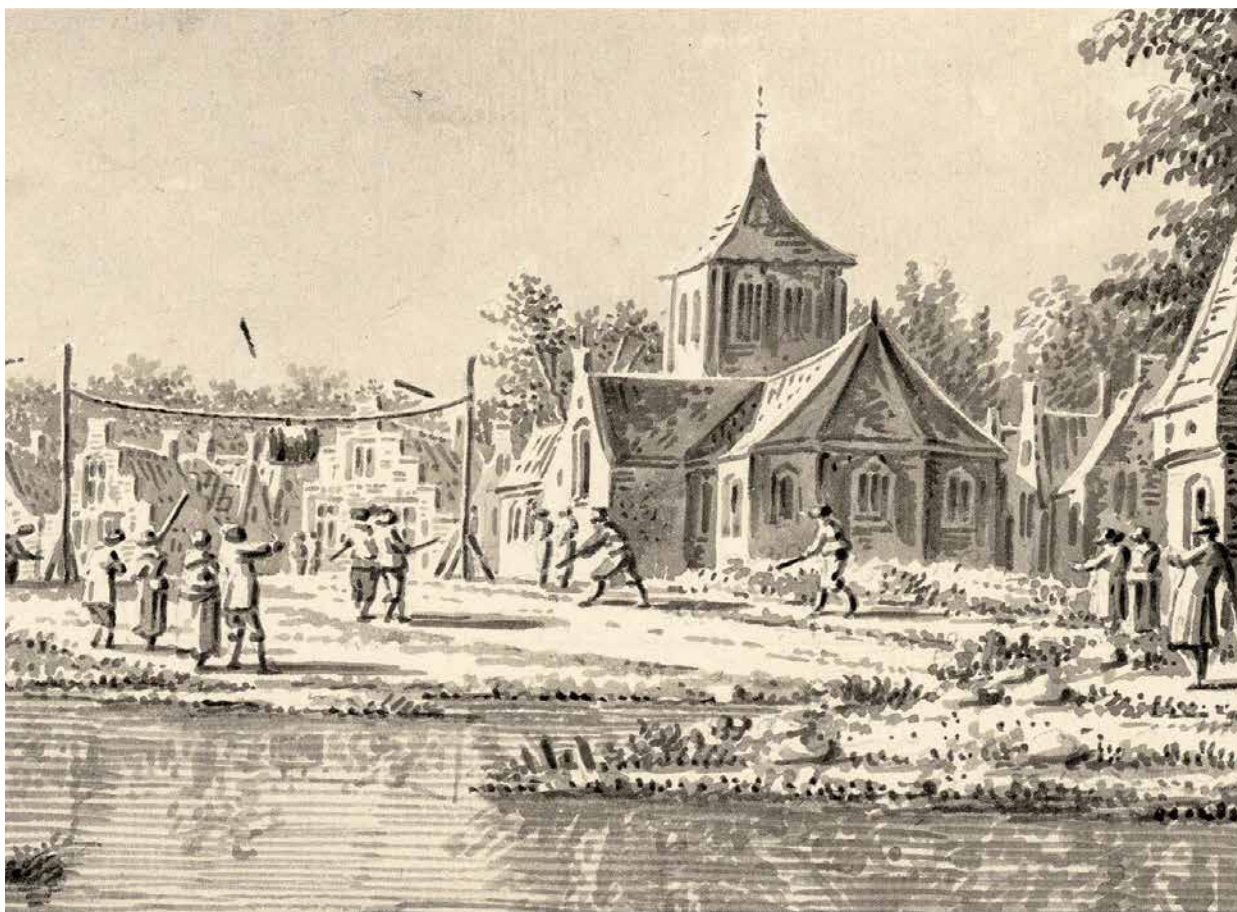
Katknuppelen op de kermis van een gefingeerd dorp, ca 1780. Prent: Dirk Verrijck. Collectie Noord-Hollands Archief 359-3398.