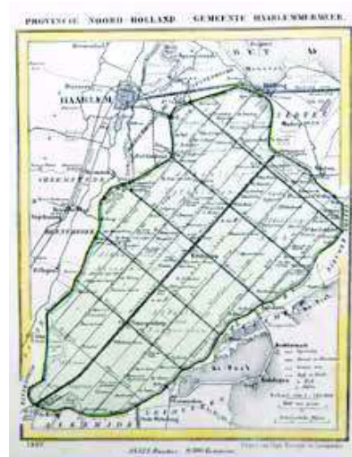
Figuur 1 Kaartje van de gemeente Haarlemmermeer uit de Gemeente-atlas van Nederland, met als belangrijkste kernen Kruisdorp en Vennepedorp. Datering: 1867.

Bij het inbinden van een provincieatlas werden de meest recente versies gebruikt. In veel gevallen was dat de eerste en enige editie van zo'n kaartje, doorgaans uit de periode 1864-1868. Als er veel vraag was naar een bepaalde gemeente of als belangrijke wijzigingen een nieuwe versie noodzakelijk maakten, verschenen er soms herziene en verbeterde edities van de kaartjes. Van veel gemeenten zijn twee versies bekend, af en toe zijn het er drie en in het geval van Haarlemmermeer maar liefst vier. De oudste versie uit 1867 is afgebeeld als figuur 1.