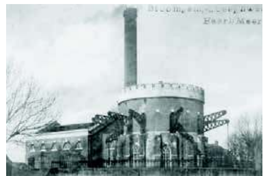
Gemaal De Leeghwater

1904) in Abbenes, die niet ver van het gemaal de Leeghwater lag. Met behulp van die wapens zouden de Duitsers van hun wandaden afgehouden kunnen worden. Wapens in je bezit hebben was echter niet ongevaarlijk, hetgeen zich laat raden. In die tijd gold namelijk het zogenaamde Schiessbefehl, wat betekende dat wanneer je op wapenbezit betrapt werd, je dit met de dood moest bekopen.