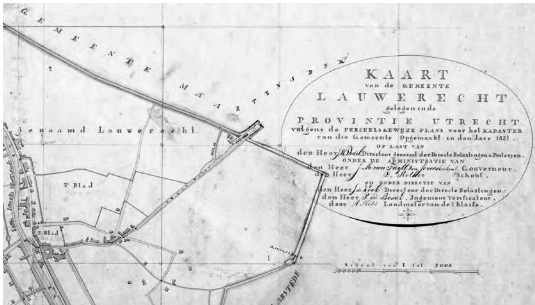
Fig. 7 Uitsnede uit de kadastrale verzamelkaart van Lauwerrecht uit 1821. Vervaardiger: landmeter Adam Slits. De kaart geeft de situatie van 1830, zonder dat is vermeld dat de oorspronkelijke kaart is bijgewerkt.