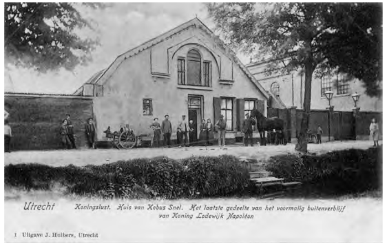
Fig. 2 Koningslust rond 1900; rechts een deel van het gebouw van de gasfabriek.

In de jaren die aan de onderhandelingen voorafgingen, waren er in de gemeente Maartensdijk in het kader van de Nieuwe Hollandse Waterlinie verscheidene verdedigingswerken uitgevoerd. Voorbeelden daarvan zijn de aanleg van het Fort De Bilt en van de inundatiekade (thans Kardinaal de Jongweg in Utrecht) met bijbehorende gracht of wetering. Daarvan kon men gebruik maken om tot een betere, goed in het terrein zichtbare grensafscheiding te komen. Men koos de buitenzijde van de fortgracht als grens; de weg eromheen bleef gemeente Maartensdijk. Aan de oostzijde van Utrecht liep de nieuwe grens rechtlijnig door langs de Ridderschapsvaart of Laanse Grift (naast de huidige Waterlinieweg) tot aan de Minstroom of Meentstroom. Daardoor 'verhuisde' bijvoorbeeld het terrein van de huidige R.K. Begraafplaats St. Barbara van Maartensdijk naar Utrecht. Aan de andere kant van het fort De Bilt kwam de gewijzigde grens te liggen langs de buitenzijde van de eveneens rechtlijnige wetering van de inundatiekade tot het punt waar de toenmalige gemeenten Utrecht, Achttienhoven en Maartensdijk samen kwamen. Als gevolg daarvan ressorteerde ook het 'vanouds gerenommeerd wijnhuis' en logement Koningslust (figuur 2) aan de weg naar Blauwkapel voortaan onder Utrecht. Harm Gerard Vriend, sinds 1827 eigenaar en