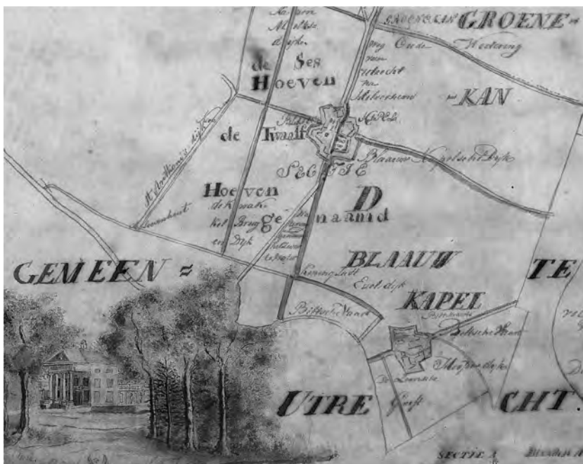
Fig. 6 Uitsnede uit de kadastrale verzamelkaart van Maartensdijk uit 1819, met daarop delen van de secties C (genaamd Groenekan), D (Blauwkapel) en E (Achtervetering). Vervaardiger: landmeter J.B. Zijlmans.

plaatste men het schild op een open plek op het kaartblad; in dit geval bevindt het zich deels onder de tekening. Kijken we wat nauwkeuriger, dan zien we ook hoe dat komt. Het grondgebied tussen het Zwarte Water en de weg naar Blauwkapel is op de tekening toegevoegd. Voordien was het een open plek waar het schild kon worden geplaatst, na de grenswijziging niet meer. De landmeter heeft nagelaten aan te geven dat de kaart rond 1830 is bijgewerkt. Ook op de kadastrale verzamelkaart van