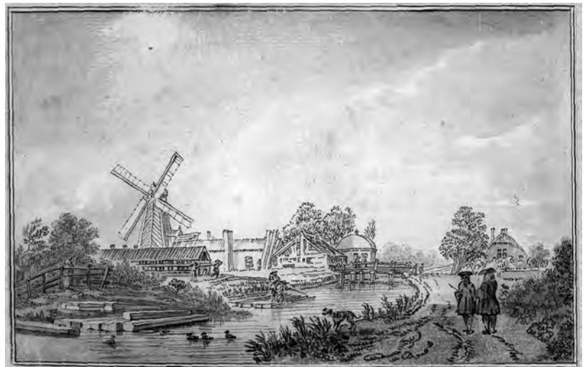
Fig. 4 Het Zwarte Water bij het Paardebrugje met links de paltrok-boutzaagmolen 'De Haas', met onder andere boutloodsen en een koepel. Datering 1735-1750.

Dat bleek niet het geval. Utrecht betaalde namelijk f 1500 aan Maartensdijk, omdat die gemeente voortaan minder inkomsten had uit gemeentelijke belastingen. De landerijen die overgingen naar Utrecht