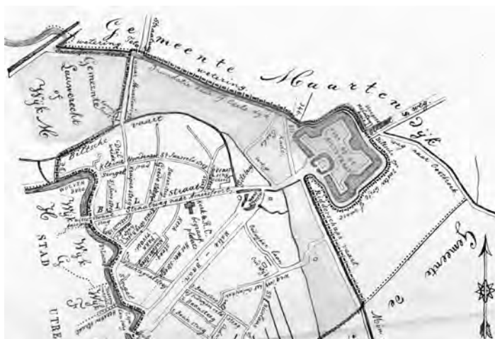
Fig. 1 Uitsnede uit een plattegrond van het noordoosten van Utrecht (Abstede). Het grondgebied dat in 1830 overging van Utrecht naar Maartensdijk is grijs 'ingekleurd'. Datering: 1859.

opstelden, leidden uiteindelijk in 1829 tot een overeenkomst. Namens Utrecht werd die ondertekend door burgemeester