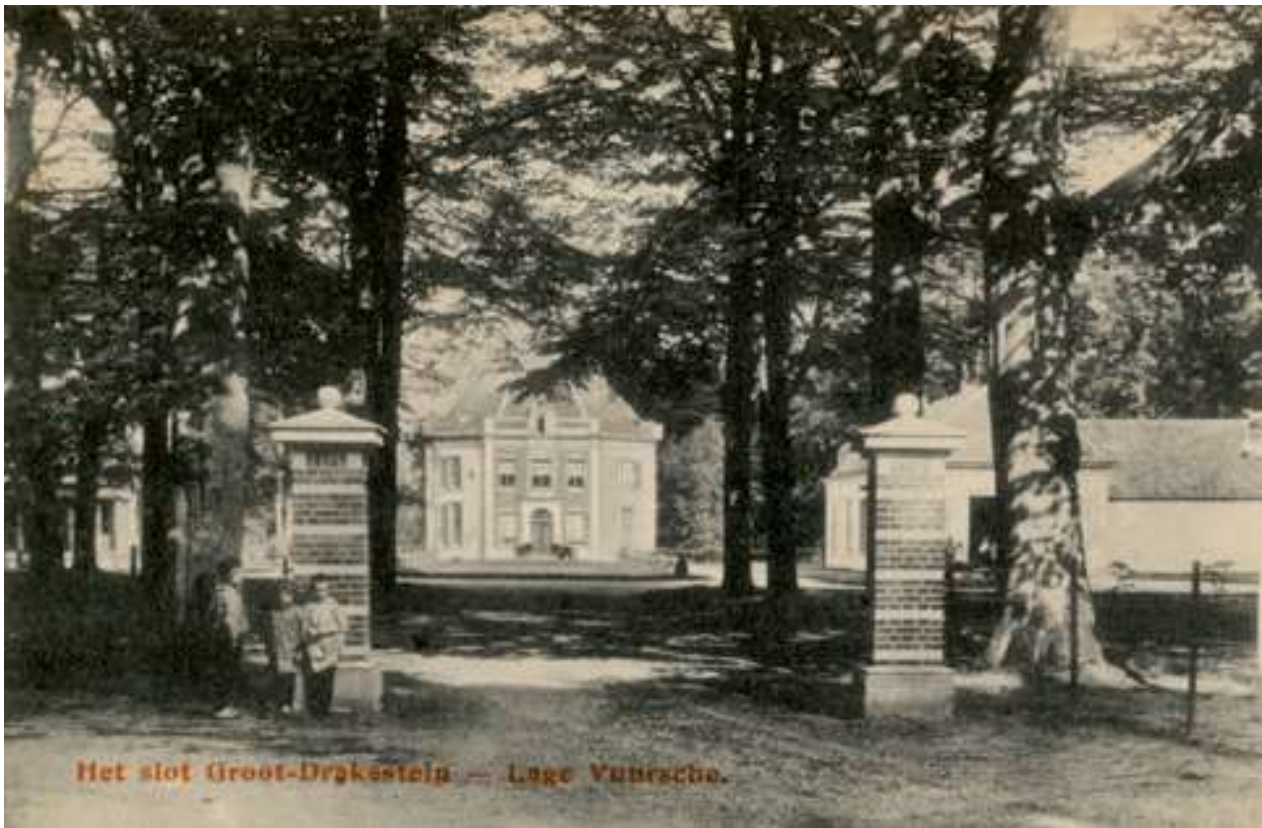
Het huis Drakesteyn te Lage Vuursche, anno 1910.

sies, aangepast worden aan de nieuwe situatie. Dat gebeurde bij de Vuursche Steeg uiteindelijk in 1919. Aan het iets geactualiseerde tarievenoverzicht werden gemotoriseerde voertuigen toegevoegd. De schaapskuddes, koebeesten, hondenkarren en mallejans bleven echter tot de formele beëindiging van de tolheffing tijdens de Tweede Wereldoorlog op de tarievenlijst vermeld staan.