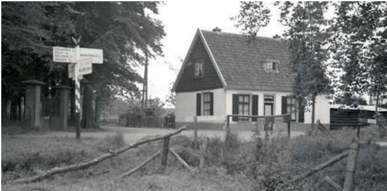
Het tolhuis op de hoek van de Maartensdijkseweg en de Vuursche Steeg, ca. 1950.

Kuus', herinnert nog aan de verwickelingen in het verleden.