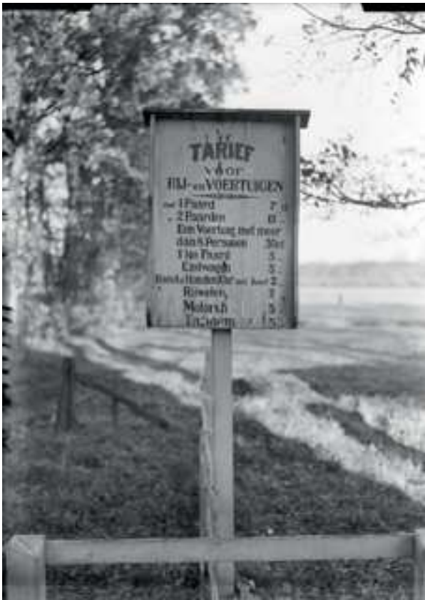
Dit tarievenbord stond bij de tol op de Hilversumseweg.