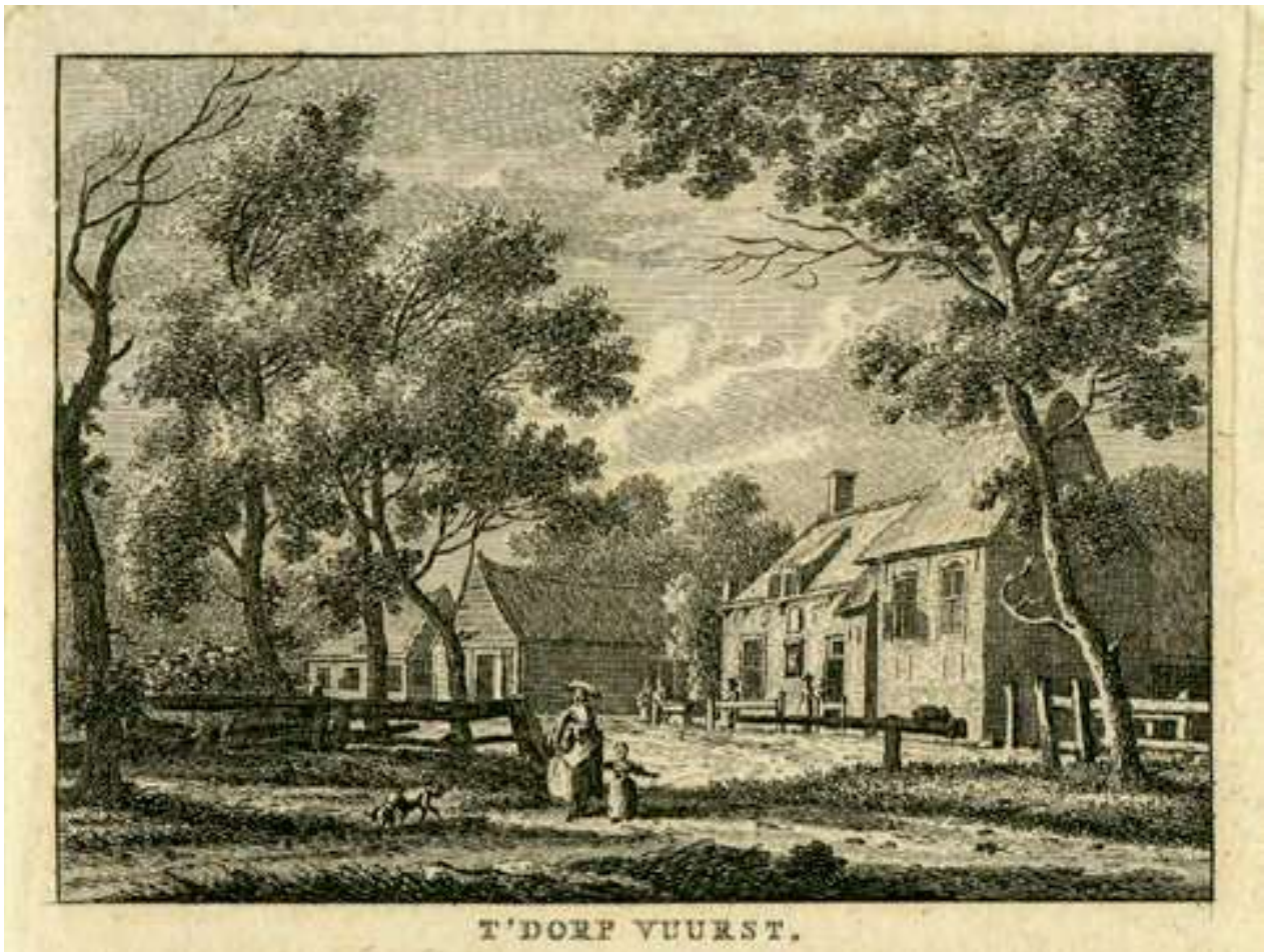
Dorpsgezicht Lage Vuursche met tolboom anno 1788, door graficus K.F. Bendorp naar een tekening van Jan Bulthuis..

den vast aan het recht van tolheffing. Hadden ze een punt?