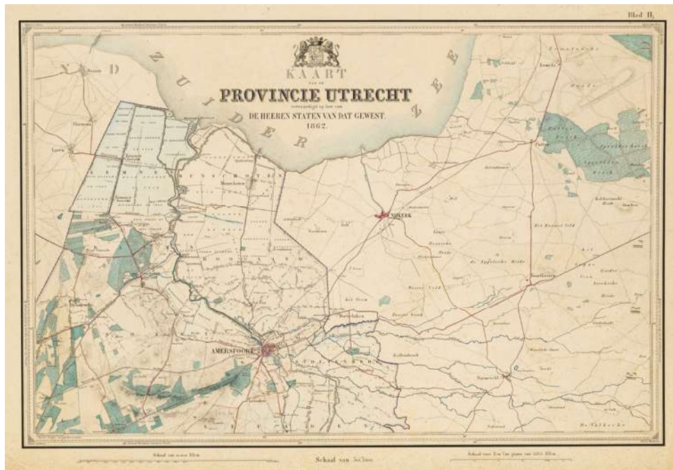
Afb. 4: Kaart van de Provincie Utrecht, herdruk 1862, blad II (vergelijk figuur 1).