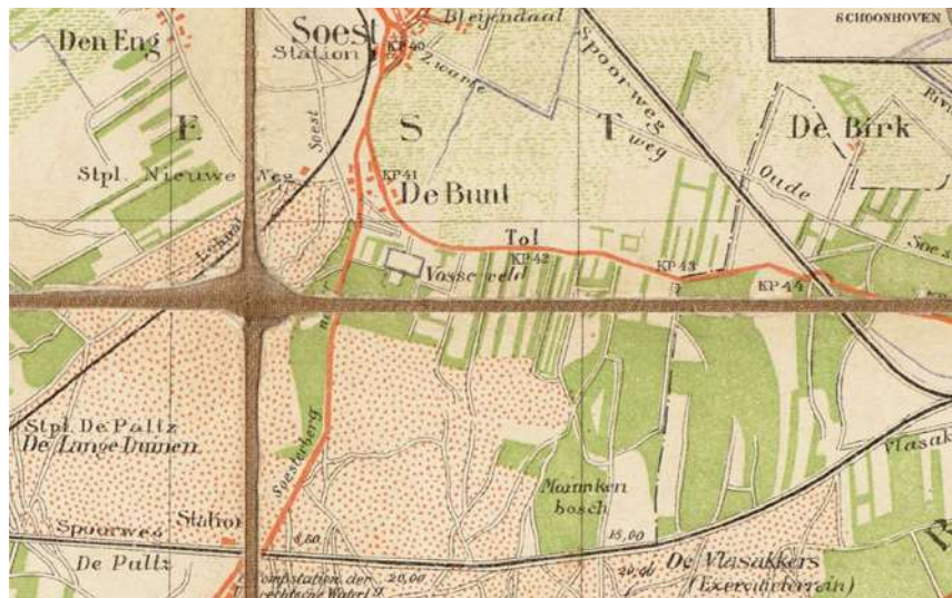
Afb. 5: Uitsnede uit de kaart van Utrecht en omstreken, uitgegeven door J. van Druuten te Utrecht omstreeks 1920.

De situering van de buurtschappen (De) Bund of (De) Bunt en (De) Birk(t) verschilt soms nogal. Gallenkamp schrijft letterlijk: “Oostelijk van dien straatweg” (van Amersfoort naar Naarden) “wordt de buurtschap in de nabijheid der buitenplaats ‘Hofslot’ genoemd ‘Birk’t’. Westelijk van die