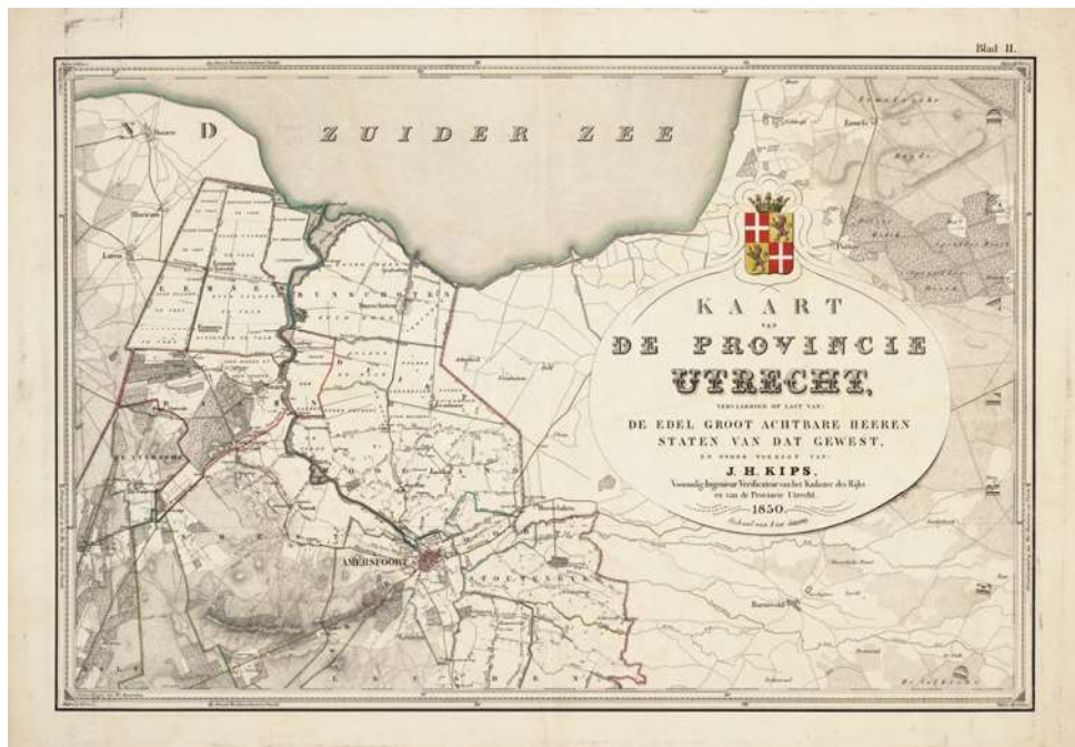
Afb. 1: Kaart van de Provincie Utrecht uit 1850, blad II, noordoost.

Rond het midden van de negentiende eeuw gaf het provinciebestuur van Utrecht de aanzet tot het vervaardigen van een nieuwe kaart van de provincie. Deze moest de vorige provinciekaart van Bernard de Roy uit 1696 (vierde editie 1799) gaan vervangen.