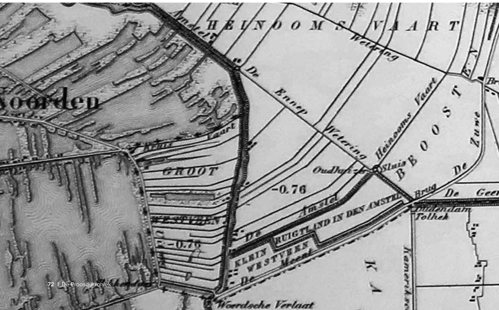
Figuur 4. Uitsnede uit de Kaart van de Provincie Utrecht, herdruk 1862, blad I (vergelijk figuur 2).

drooglegging en verkaveling van de 2 e bedijking was net voltooid; dat moest dus bij een herdruk aangepast worden en het Stoomgemaal Van Heemstra moest worden ingetekend. Wat dat betreft zaten de hoofdingenieur van de waterstaat en de burgemeester op één