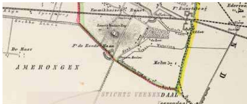
Uitsnede uit het Kuyperkaartje van de gemeente Renswoude. Datering: 1865 (collectie Regionaal Archief Zuid-Utrecht)

De grenzen van Veenendaal en de aangrenzende Utrechtse gemeenten waren officieel vastgelegd onder Nederlands bestuur in 1818. Bij die grensbepalingen ging de voorkeur uit