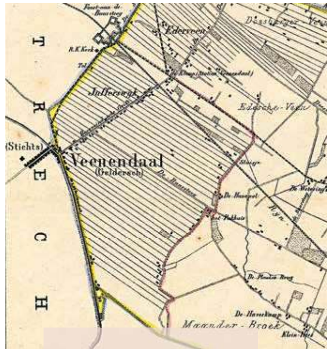
Uitsnede uit het Kuyperkaartje van de gecombineerde kadastrale gemeenten Ede en Geldersch Veenendaal, onderdeel van de burgerlijke gemeente Ede. Datering: 1867

Het gebruik van kleur had voor zowel de auteur ('het zal wonderen doen voor het oog') als voor de uitgever een hoge prioriteit. Suringar had