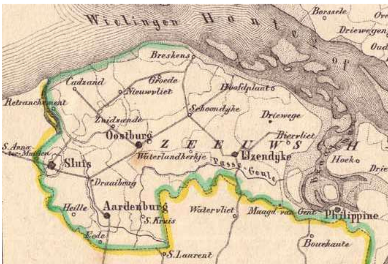
Uitsnede uit het provinciekaartje van Zeeland uit de Gemeente-atlas van Zeeland door Jacob Kuiper.

Na deze positieve recensie stuurde Suringar nog twee kaartjes op, die toen nog niet waren verschenen en waarvan hij kon vermoeden dat Roos er belangstelling voor zou hebben. Het ging om Sluis en Aardenburg. Het kaartje van Sluis bevatte volgens het weekblad 'eene fraaie miniatuurafbeelding