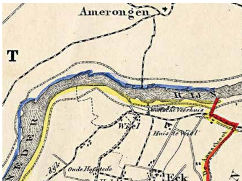
Fig. 4: Uitsnede uit het kaartje van de gemeente Maurik uit de Gemeente-atlas van Gelderland.

Hetzelfde zien we bij vergelijking van de kaartjes van Amerongen en de aan de overzijde van de Nederrijn gelegen gemeente Maurik (figuur 4).