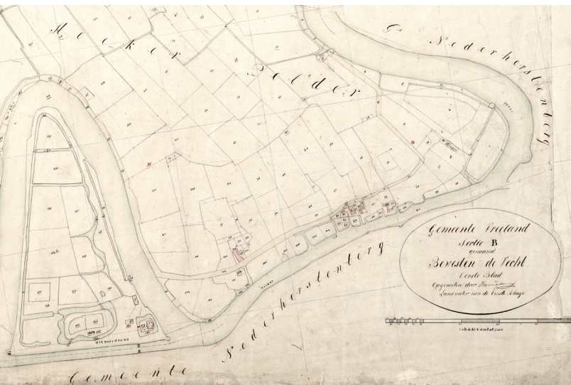
Afbeelding 6. Uitsnede uit een kadastrale kaart (minuutplan sectie B eerste blad) van Vreeland uit 1828. Noord is rechts. Vervaardiger: J.B. van Zijlmans.

Breukelen St. Pieters. De kwestie rond de Nes was echter nog niet opgelost, ook al was Van den Aniel ervan overtuigd dat het gebied bij Vreeland hoorde. In het proces-verbaal werd de grens door de Nieuwe Vecht gelegd, zodat de Nes tot Vreeland zou behoren. Burgemeester Sanderson van Nederhorst den Berg kon zich daarin uiteraard niet vinden. Hij weigerde dan ook het artikel met de op die wijze beschreven grens voor akkoord te ondertekenen. Overigens signeerde hij het proces-verbaal van Vreeland wel namens zijn woonplaats Loenen, Loenersloot, Nigtevecht en Kortenhoef, ge-