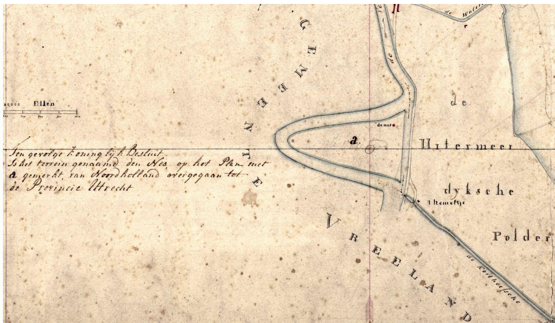
Afbeelding 7. Uitsnede uit de kadastrale verzamelkaart van Nederhorst den Berg uit 1818.

Vervaardiger: A. van Oosterhout. Noord is boven. De Nes, gemarkeerd met een later toegevoegde letter a, maakte deel uit van die gemeente.