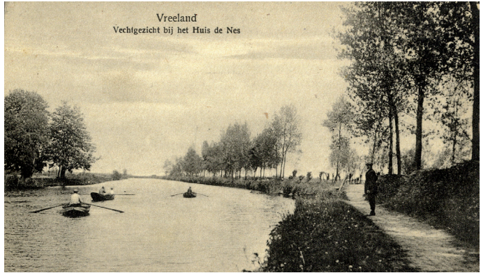
Afbeelding 2. Vechtgezicht bij het huis 'De Nes', Vreeland. Vervaardiger: M. Scheepmaker. Datering: onbekend.

Uit de tekst van het proces-verbaal is op te maken, dat alle belanghebbenden het erover eens waren dat het eerder genoemde Realeneiland behoorde tot de gemeente Nederhorst den Berg. Uiteindelijk kwamen de landmeters in Vreeland opdagen in 1828. Daarbij schuwden ze kennelijk wat extra werk niet: ook het Realeneiland werd door hen in kaart gebracht, ditmaal als onderdeel van het grondgebied van de gemeente Vreeland (afb. 6). Hadden ze zich onvoldoende geïnformeerd over de ligging van de gemeentegrenzen?