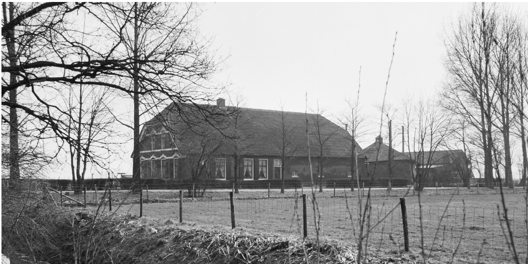
2. Boerderij van de familie Baelde, Hoofddijk 49, gezien vanaf de Bunnikseweg. Ter hoogte van de voordeur stond destijds een tolboom. Datering: maart 1979.

Kennelijk was deze tol op de provinciekaart vergeten of door de kaartenmakers over het hoofd gezien. In een notitie uit 1856 van de hoofdingenieur van de provinciale waterstaat, waarin werd opgesomd welke correcties of aanvullingen er nodig waren op de provinciekaart bij een geplande herdruk, is namelijk te lezen dat er een tol aangeduid moest worden aan het einde van de Hoofddijk bij Oostbroek. In de tweede editie van de kaart uit 1862 is deze vijfde Biltse tol inderdaad opgenomen. De tol werd later ook aangegeven op onder andere de officiële topografische kaarten in de uitgaven van 1910 (figuur 3) tot 1953 en met twee dwars op de weg getekende streepjes op een toeristenkaart van de provincie Utrecht van omstreeks 1940 (figuur 4). Op deze laatstgenoemde kaart staat de Hoofddijk, evenals in diverse stukken betreffende de tol, overigens aangeduid als Oostbroekselaan. Deze tol aan de Hoofddijk is de minst bekende tol van De Bilt.