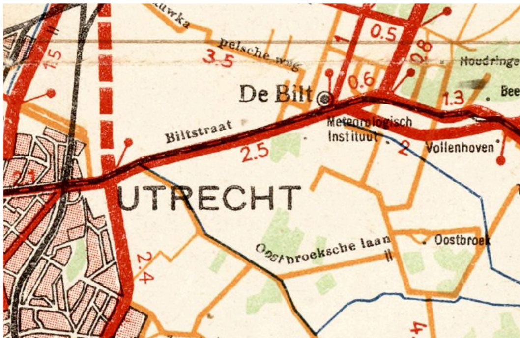
4. Uitsnede uit de Kompas-toeristenkaart Utrecht. Datering ca. 1940.

Bij de argumenten die over en weer werden uitgewisseld, speelde ook de aanwezigheid van de tol een rol. Gemotoriseerd verkeer was, zoals we zagen, niet welkom, maar fietsers, koeien en al dan niet aangespannen paarden mochten blijken een bij de tol geplaatste tarievenlijst, na betaling de tol passeren. Van Reek concludeerde uit de aanwe-