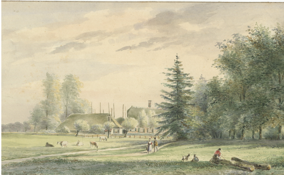
8. Gezicht vanuit het park van het landgoed Oostbroek bij De Bilt op een nabijgelegen boerderij in de tijd van Abraham Bierens de Haan. Prent van P.J. Lutgers, gemaakt voor de veiling van het landgoed in 1842. Bron: Beeldbank Het Utrechts Archief, cat.nr.201721.

ten of liggen aan een openbare weg, gelegen ten zuiden van de Utrechtseweg. Dit laatste gold overigens niet voor echtparen of familie in de eerste en tweede graad en hun huwelijkspartners.