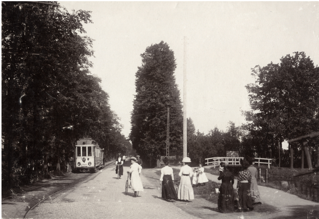
7. Het bruggetje over de Biltse grift aan het noordwestelijke uiteinde van de Hoofddijk of Oostbroekselaan bij de Biltsestraatweg. Datering: 1910-1921.