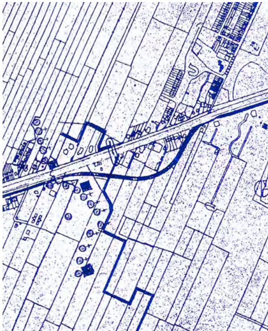
Figuur 4. Zig-zag verlopende tankgracht aan de oostzijde van de Werken van Griftenstein.

regels te versoepelen en het strenge regime van de vestingwet alleen van toepassing te verklaren op het gebied direct aansluitend ten oosten van de werken dat in figuur 2 is gearceerd van linksboven naar rechtsonder en op het gearceerde gebied ten westen van Griftenstein-Zuid. Zo kon de gemeente Maartensdijk in 1927 zonder problemen een vergunning afgeven voor de bouw van huizen in de Veldzichtstraat (13), vlak bij de Werken van Griftenstein. Er werden daar uiteindelijk 22 stenen woningen gerealiseerd. In de jaren dertig kwamen er langs de Utrechtseweg ten westen van de Veldzichtstraat op