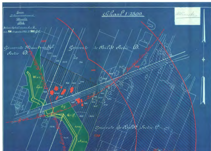
Figuur 2. Militaire kaart van de Werken van Griftenstein uit 1923. Bestaande bebouwing in steen vlak voor de verdedigingswerken is aangegeven in rood. De rode, getrokken bogen geven de buitenste begrenzing aan van de binnenste kring en de middelste kring rond de Werken van Griftenstein. De rode, gestreepte bogen geven de buitenste begrenzing van de buitenste kringen van respectievelijk Fort De Bilt (links van boven naar beneden) en Fort Voordorp.

meer worden geruimd. De houten bouwsels, waarvan er bijvoorbeeld nog enkele staan aan de noordzijde van de Biltsestraatweg tussen Fort De Bilt en de A27, konden dan worden platgebrand. Stenen gebouwen die er al stonden voor de verdedigingswerken werden gebouwd, mochten blijven staan; bij eventuele vernieling daarvan als gevolg van oorlogsdreiging werd een schadevergoeding uitbetaald. De kringenwet waarin een en ander werd geregeld, was bijna honderd jaar van kracht - van 1853 tot 1951 - maar werd pas in 1963 officieel ingetrokken.