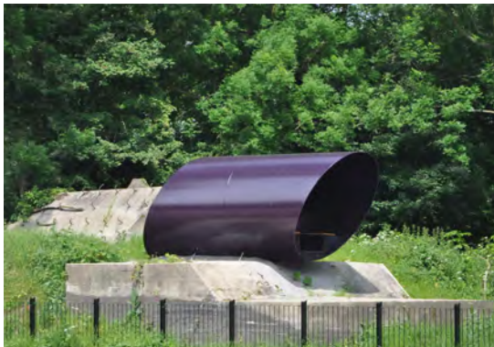
Figuur 1. Gevechterskazemat met recent geplaatste beschutte zitplek (voor) en piramidevormige kazemat bij de Werken bij Griftenstein aan de noordzijde van de Utrechtseweg, 2015.

Wie over de Utrechtseweg van De Bilt naar Utrecht rijdt, passeert net voorbij de benzinstations de Werken bij Griftenstein . Lange tijd was daar weinig van te zien. Na een opknapbeurt van het gebied is de voorheen door weelderig groen vrijwel aan het zicht onttrokken gevechterskazemat aan de noordzijde van de weg nu echter nadrukkelijk aanwezig, mede door de erop aangebrachte beschutte zitplek (figuur 1). Aan het eind van het nieuw aangelegde voetpad is op de noordelijkste kazemat een uitkijktoren geplaatst met uitzicht over de Voorveldse polder.