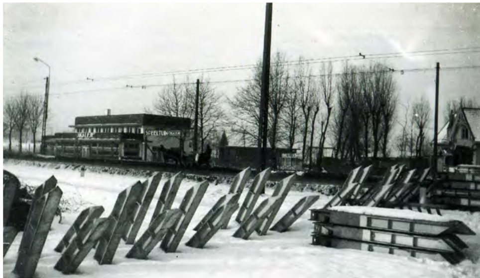
Figuur 5. De aspergeversperring op de Biltsestraatweg tussen Fort De Bilt en de Werken van Griftenstein nabij café-restaurant 't Kalfje in januari 1940. Voor de tram en het overige verkeer was een smalle doorgang opengelaten.

1940 vanuit een vliegtuig gefotografeerd. Destijds was er minder begroeiing rond forten en stellingen, zoals onder andere blijkt uit de foto van de Werken van Griftenstein (figuur 6). Op de foto is ook de bebouwing van de Veldzichtstraat en vandaar langs de Biltsestraatweg richting Utrecht goed te zien. De in figuur 4 geschetste tankgracht is op de foto eveneens terug te vinden. In het voorjaar van 1940 besloot de legerleiding de verdediging tegen een mogelijke Duitse inval te concentreren op de Grebbelinie. Tegelijkertijd werden alle investeringen in de Vesting Holland, dus ook in de Werken van Griftenstein, opgeschort.