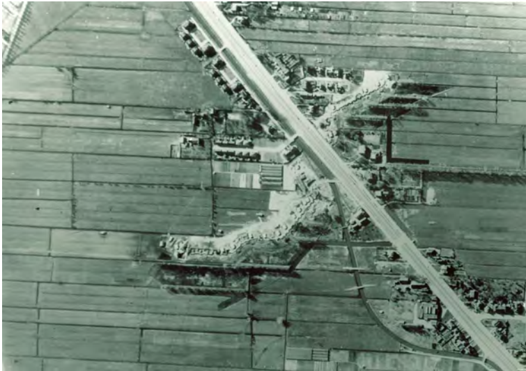
Figuur 6. Luchtfoto van de Werken bij Griftenstein, gemaakt in de winter van 1939-1940.

dat was eerder uitzondering dan regel. Soms zaten ze op slot en wist niemand waar de sleutel was. Bovendien kwamen de Nederlandse soldaten hier in absoluut onbekend terrein, terwijl de Duitse troepen hen op de hielen zaten. Het moreel van de troepen was er niet beter op geworden na het bekend worden van het nieuws dat de Koningin en de Regering vertrokken waren naar Engeland. Van een eventuele inundatie was bij de Werken van Griftenstein weinig of niets te merken (15,16); hooguit waren er her en der in de weilanden wat plassen of wat modder. Het besluit tot inundatie was namelijk pas in de avond van 12 mei genomen en het vollopen van de kommen duurt onder normale omstandigheden al vier tot twaalf dagen, bij