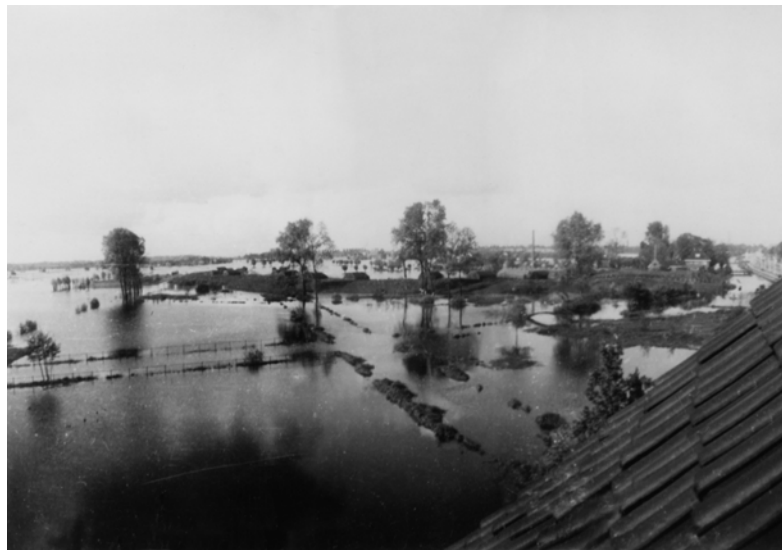
Figuur 7. Inundatie bij de Werken van Griftenstein zuidzijde, 1945.

In het voorjaar van 1945 werd de Nieuwe Hollandse Waterlinie voor het eerst grootschalig onder water gezet; dat gebeurde overigens door de Duitse bezetter. Daarbij kwamen ook grote stukken land tussen Utrecht en De Bilt, waaronder landerijen bij de Werken van Griftenstein, enige tijd onder water te staan (figuur 7).