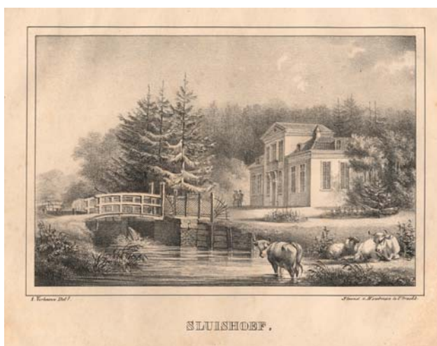
Figuur 3: Gezicht op de Biltse grift bij Sluishoef (thans Utrechseweg 315, tegenover Kerklaan). Prent naar een tekening van A. Verhoesen uit 1829 (3).