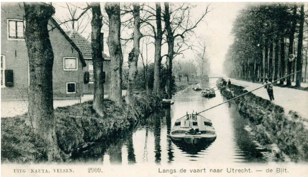
Figuur 1: Gezicht op de Biltse grift bij Vreelust, 1905. Deze boerderij werd gebouwd in 1882, afgebroken in 1965 en stond op het huidige Hessing-terrein. Rechts de Utrechtseweg met bijbehorende bomenrijen en het zuidelijke zandpad.

In 1642 werd de Biltse en Zeister grift in gebruik genomen als scheepvaartverbinding met Utrecht. De vaart strekte zich uit van de Utrechtse Stadsbuitengracht (singels) tot aan de Stoetwegense dijk (thans Bunsinglaan) in Zeist. Het langs de Steenstraat (thans Utrechtseweg, De Bilt, Biltsestraatweg en Biltstraat in Utrecht) gelegen gedeelte van de vaart werd gevormd door een reeds aanwezige, maar