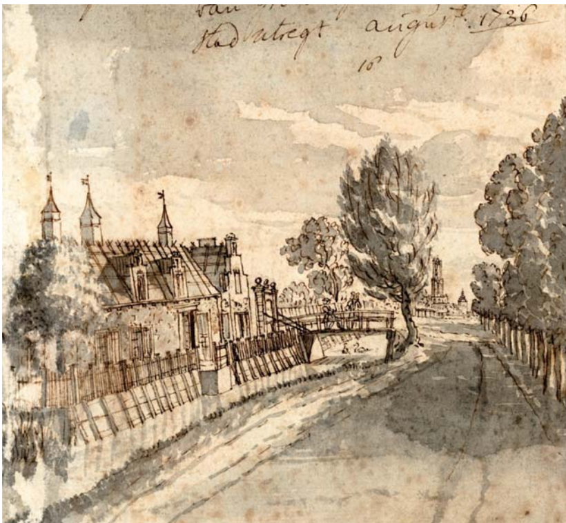
Figuur 4: Gezicht op de Biltse grift met aan de zuidzijde (links) het huis Groenestein. Anonieme tekening, 1736.

de waterkant te laten grazen of wroeten. Als de zogeheten zomerweg, het zandpad tussen de bestrate Steenstraat en de grift, in te slechte staat was om te gebruiken, werd hij met een draaiboom afgesloten,