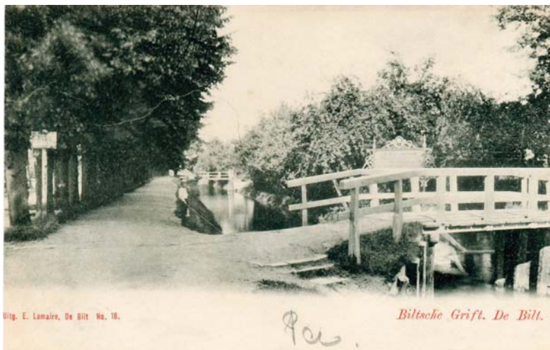
Prentbriefkaart van de Biltse Grift te De Bilt, gem. Maartensdijk, ter hoogte van de Oostbroekselaan, 1903. Links achter de bomen loopt buiten beeld de huidige Biltsestraatweg.