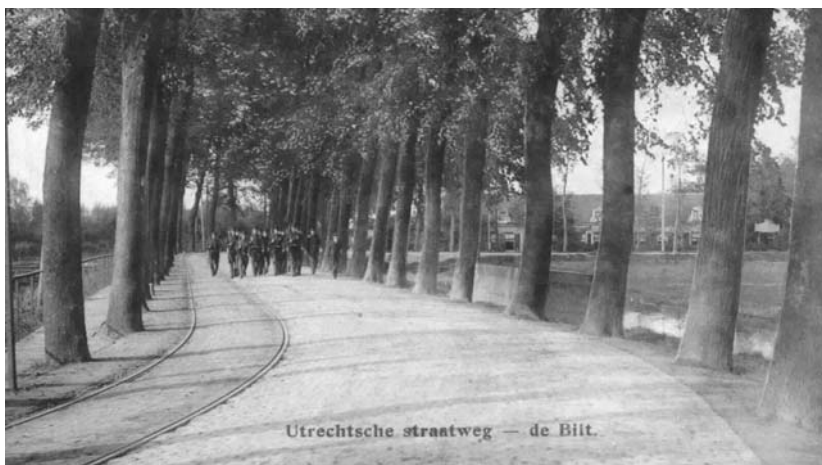
Prentbriefkaart van de Utrechtsche straatweg te De Bilt, gem. Maartensdijk ter hoogte van het Fort De Bilt. Datering: 1905-1910.

Door de bebouwing die in het gebied aan-