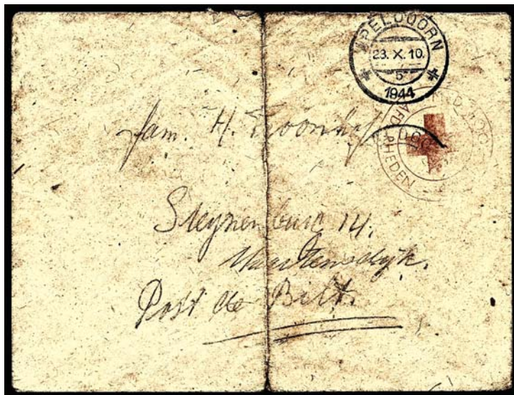
Envelop van een brief uit 1944 geadresseerd aan: Steinenburg 14, Maartensdijk (post De Bilt). De brief is via het 'Roode Kruis/afd. Rheden en via het postkantoor van Apeldoorn verzonden aan de fam. Froonhof. De vermelding van Froonhof in de telefoongids van 1943 geeft als adres: Biltchestratweg 14.