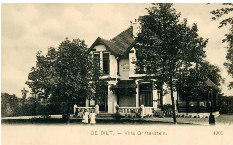
Prentbriefkaart van Villa Griftenstein, De Bilt, gem. Maartensdijk, ca. 1910.

Daarbij wordt nog vermeld dat de buurtschap behoort tot Blaauwcapel. Hier is dus al duidelijk sprake van een De Bilt, gem.