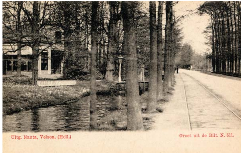
Prentbriefkaart met 'Groet uit de Bilt' van de in 1903 afgebroken villa Steijnenburg aan de Biltstraat (1), De Bilt, gem. Maartensdijk. Datering: rond 1900. In de tuin staat een bord met de tekst: 'Café Restaurant Steijnenburg'. Later verrees hier het woningcomplex Steinenburg, Utrechtseweg 378-392, De Bilt. Bron: Het Utrechts Archief, catalogusnummer 8137.

is afkomstig van een villa Steijnenburg, die tot 1903 dienst heeft gedaan als café-restaurant (figuur 5). Daarna werd het pand gesloopt om plaats te maken voor het woningcomplex Steinenburg (thans Utrechtseweg 378-392, De Bilt), een onderdeel van het 'villapark Steinenburg'.