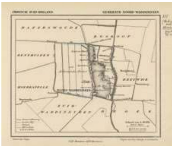
Kaartje van de gemeente Noord-Waddinxveen. Datering: z.j. [1870].