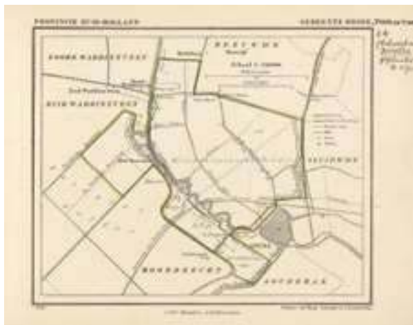
Kaartje van de gemeente Broek. Datering: 1867.

jes en werd aangeboden voor een prijs van ongeveer zestien gulden. Een atlas van heel Nederland met iets meer dan 1200 kaartjes kwam op circa zeventig gulden. Complete exemplaren van de gemeenteatlases van de elf provincies bestonden steeds uit een titelblad, een register waarin de namen van alle gemeenten in de provincie waren opgenomen, de gemeentekaartjes en tot slot een overzichtskaart van de provincie. Een atlas van het hele land werd voorzien van een register met de namen van alle gemeenten in Nederland.