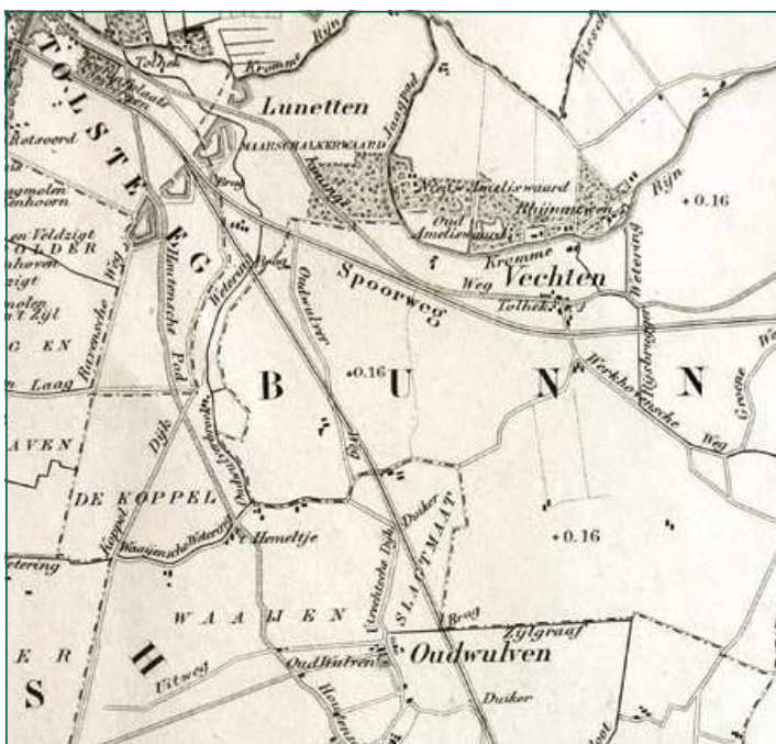
Figuur 4. Uitsnede uit de Kaart van de Provincie Utrecht, herdruk 1862, blad III. De Oudwulverbroek wetering en de Waayense Wetering zijn nu correct weergegeven. De vier Lunetten op de Houtense vlakte zijn op deze kaart veel nadrukkelijker afgebeeld dan op de oorspronkelijke kaart van 1850 (figuur 3). Verder zien we nu vanaf de Lunetten de spoorlijn naar 's-Hertogenbosch. De gemeenteaanduiding Rhijnauwen, die nog vermeld was op figuur 3, is na de fusie met Bunnik komen te vervallen

geklaard; er waren 250 kaarten gedrukt. 3 Het resultaat 4 laat zien in welke mate de Hoofdingenieur van de Waterstaat en de burgemeesters hebben bijgedragen aan het eindresultaat.