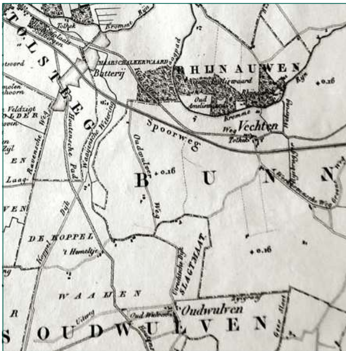
Figuur 3. Uitsnede uit de Kaart van de Provincie Utrecht uit 1850, blad III. De Oudwulverbroek Wetering is volgens de burgemeester van Houten ten onrechte aangeduid als Waayense Wetering