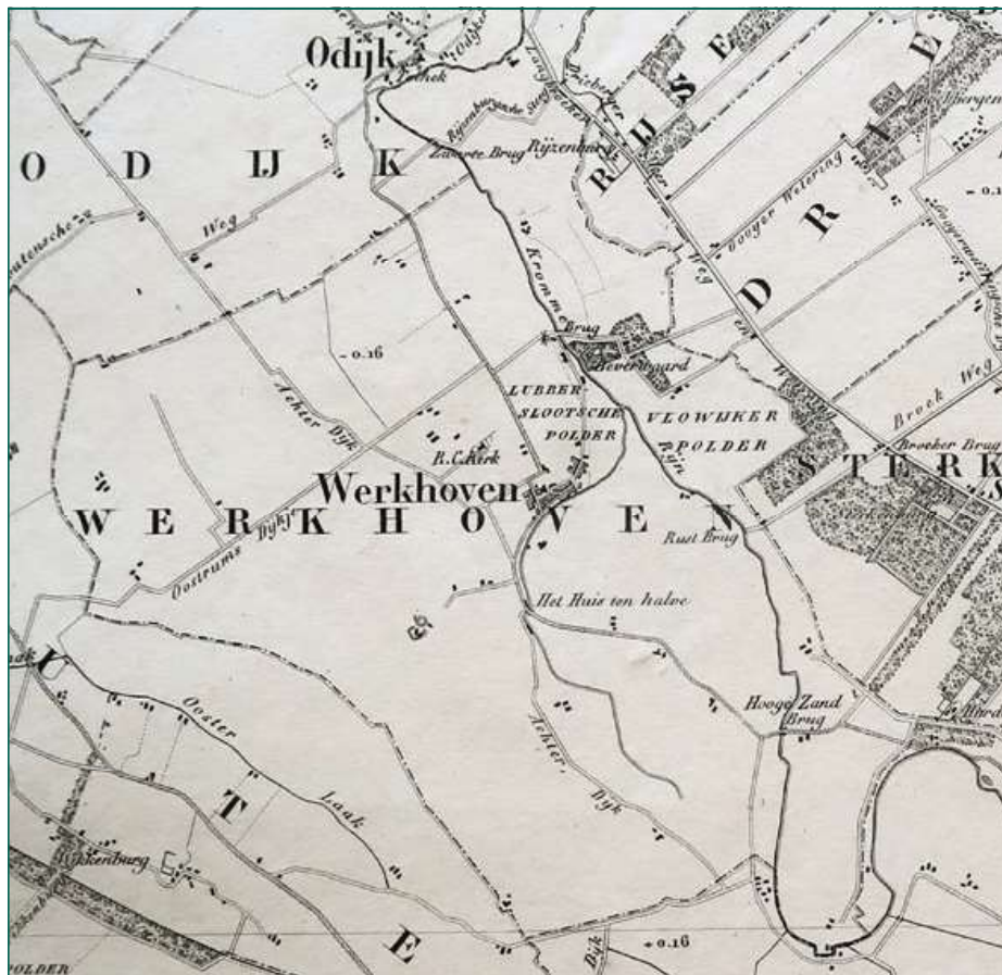
Figuur 1. Uitsnede uit de Kaart van de Provincie Utrecht uit 1850, blad IV. De Lubberslootsche polder en de Vlowijker polder bij Werkhoven zijn volgens de burgemeester van die gemeente onjuist weergegeven

den verbeteringsuggesties en aanvullingen voor de provinciekaart; een hele waslijst. Het aantal correcties en mutaties was zo groot dat het provinciebestuur besloot de kaart geheel opnieuw te laten tekenen en graveren. Samensteller en tekenaar A.A. Nunnink, die de kosten van zijn bijdrage aan de tweede druk aanvankelijk had begroot op honderd gulden, moest gezien de vele correcties zijn offerte bijstellen naar 150 tot 175 gulden. Het opnieuw in koper graveren van de kaart kostte 3000 gulden; als het slechts om enkele kleine wijzigingen was gegaan, zou een bedrag van 300 tot 350 gulden hebben volstaan. De gehele, ook nu weer uit vier bladen bestaande kaart moest klaar zijn binnen drie jaar na het afleveren van het eerste blad.