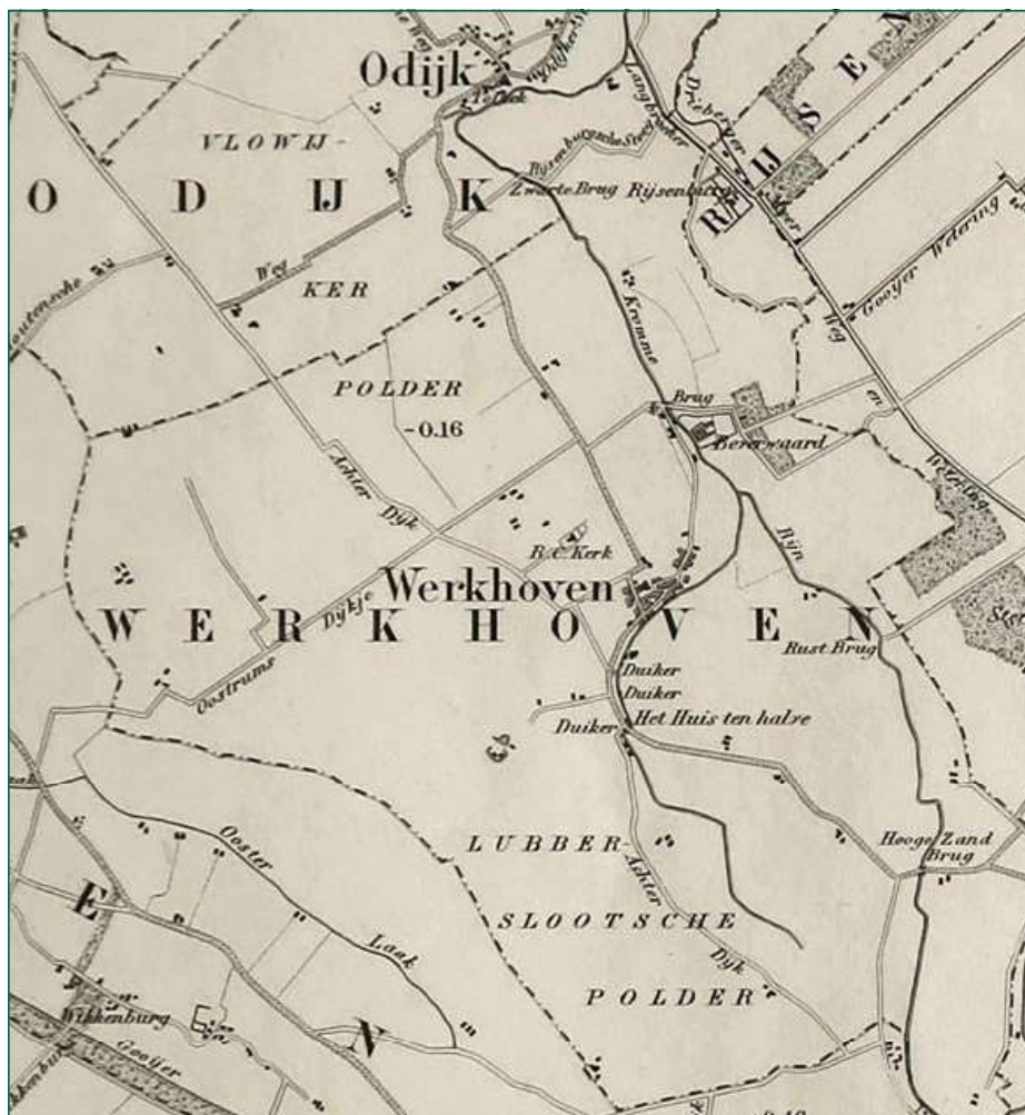
Figuur 2. Uitsnede uit de Kaart van de Provincie Utrecht, herdruk 1862, blad IV (vergelijk figuur 1). De posities van de Lubberslootsche polder en de Vlowijker polder bij Werkhoven zijn gecorrigeerd. De gemeenteaanduiding Sterkenburg (ST midden-rechts), die nog te zien was op figuur 1, is na de fusie met Driebergen komen te vervallen