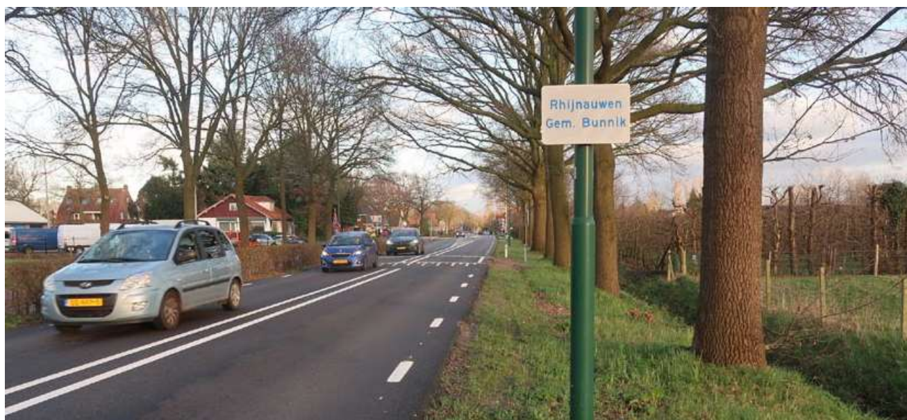
8 Plaatsnaambord langs de Provinciale weg in Bunnik. Het hier aangeduide gebied lag echter niet in de negentiende-eeuwse gemeente Rhijnauwen.

Veel van de hier beschreven informatie is gebaseerd op jaarverslagen van de gemeente en op correspondentie, vooral met hogere overheden. Problemen die zich elders voordeden, bleven de gemeente bespaard, zo is uit diezelfde bronnen af te leiden. Er woonden in de gemeente geen blinden of krankzinnigen. Armoede was er