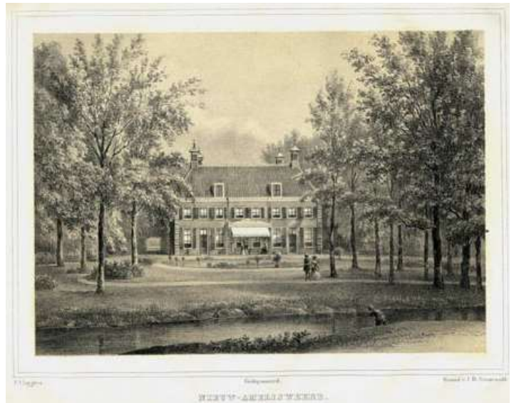
2 Gezicht op het huis Nieuw Amelisweerd met op de voorgrond de Kromme Rijn. Tekening van P.J. Lutgers uit 1869, toen Rhijnauwen reeds was samengevoegd met Bunnik.