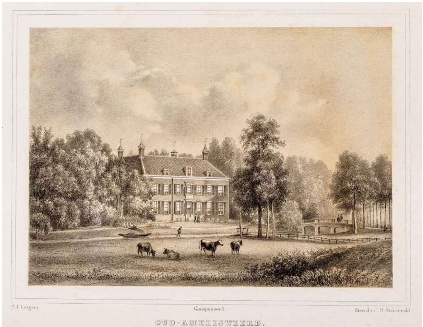
4 Gezicht op het huis Oud Amelisweerd met op de voorgrond de Kromme Rijn. Tekening van P.J. Lutgers, 1869.

Strick van Linschoten was de enige inwoner van de gemeente die meer dan dertig gulden belasting betaalde en volgens de regels van het toenmalige kiesstelsel stemrecht bezat. 4