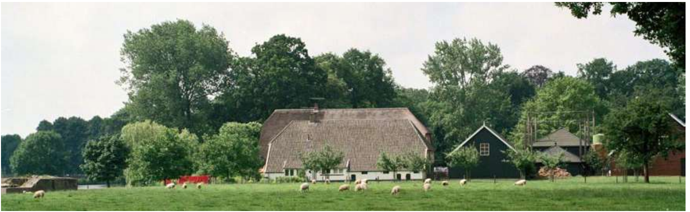
6 Gezicht op boerderij Hofstede Rhijnauwen met bijgebouwen, 15 mei 2003.

Rhijnauwen en de landbouwers Cornelis van Leeuwen (Amelisweerd) en Jan Middelman (Rhijnauwen).