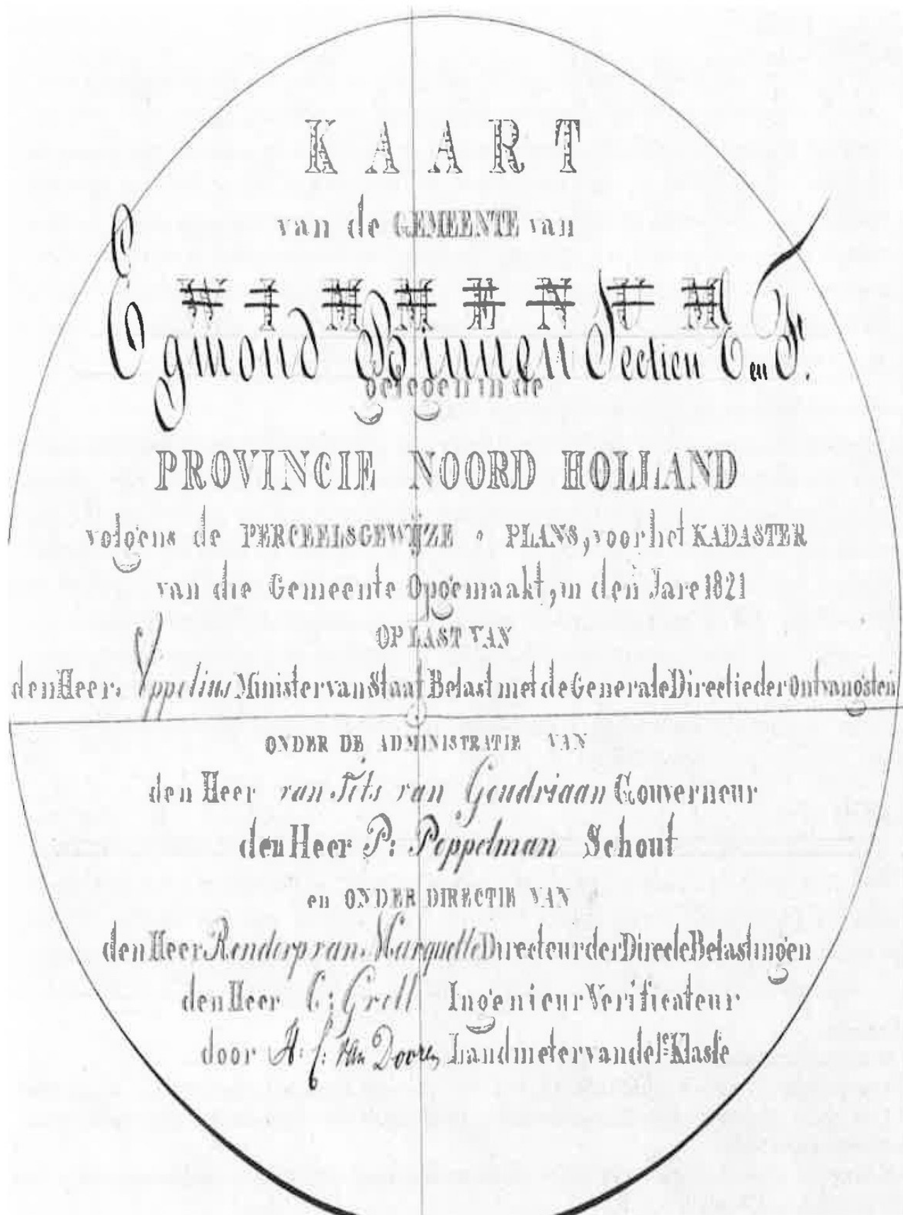
Afb. 22 Detail uit afbeelding 19, rechtsonder. Na de samenvoeging van Wimmenum met Egmond-Binnen van 1857 is op de kaart uit 1821 de gemeentenaam Wimmenum doorgehaald en vervangen door 'Egmond-Binnen, sectien E en F'. (de vroegere secties A en B).