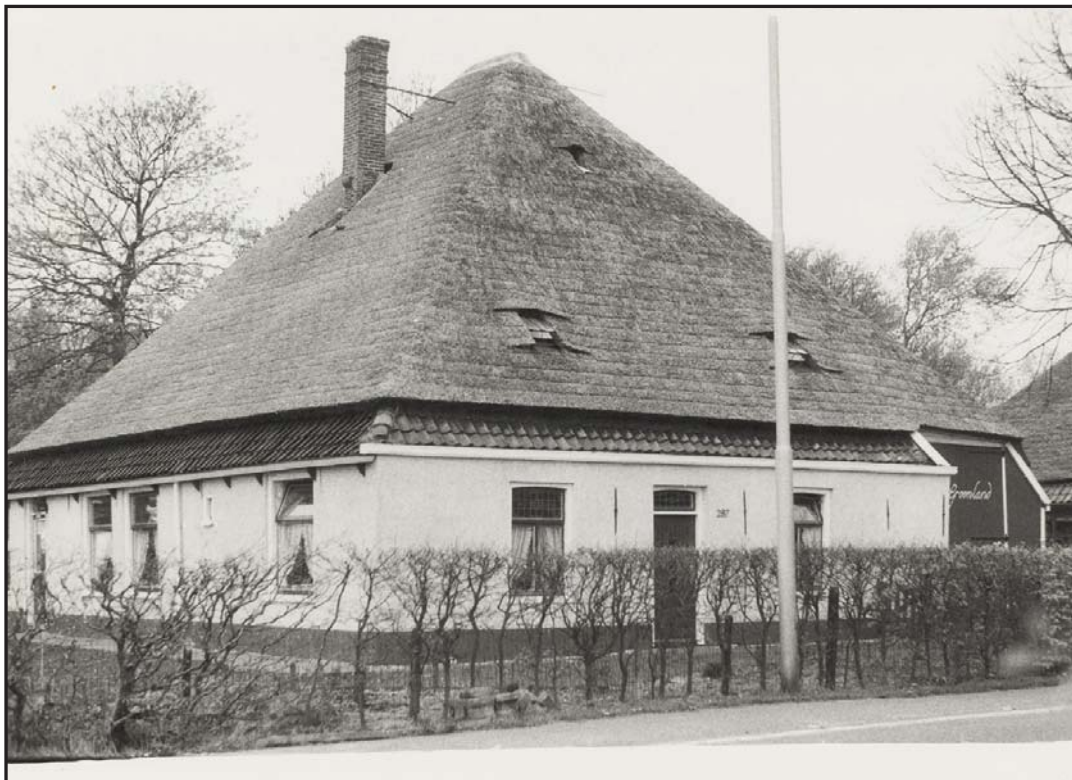
Afb. 4 Hoeve Groenland, Herenweg 287, Egmond aan den Hoef, destijds eigendom van Cornelis Wittebrood. RAA FO206024