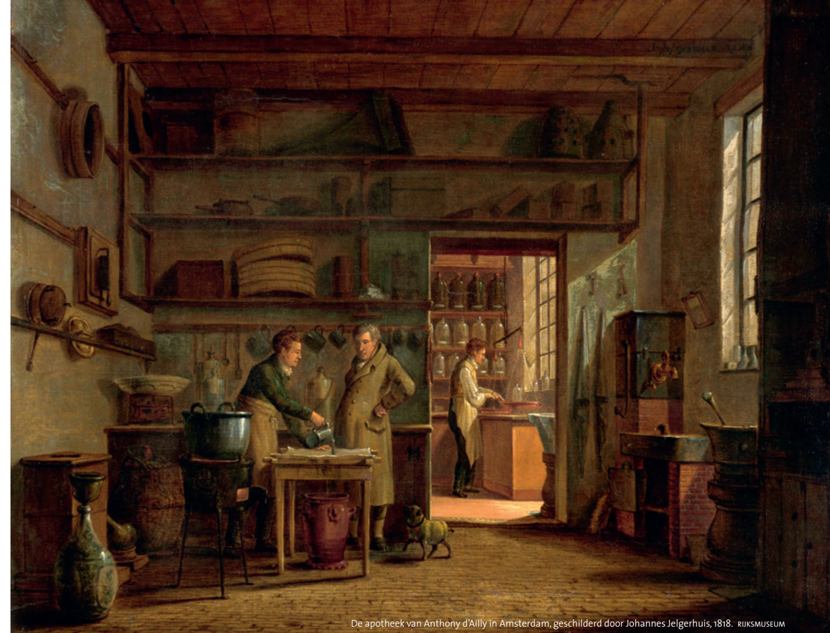
De apotheek van Anthony d'Ailly in Amsterdam, geschilderd door Johannes Jelgerhuis, 1818.